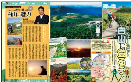
<「白山に登ろう！」誌面>