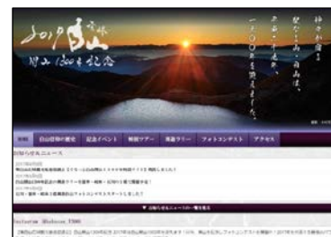
&lt;ぐるっと白山 1300 年特設サイト TOP&gt;

ほか白山開山 1300 年 PR ポスターの制作も行い、既に各所での掲出が始まっています。昭文社ではあらゆる媒体、機会を通じて、白山開山 1300 年記念の各種事業、イベント、観光を盛り上げて参ります。