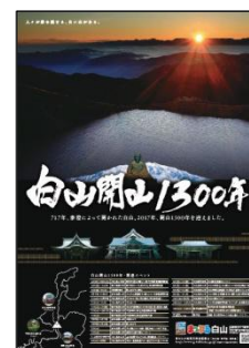
&lt;ポスターイメージ&gt;

ほか白山開山 1300 年 PR ポスターの制作も行い、既に各所での掲出が始まっています。昭文社ではあらゆる媒体、機会を通じて、白山開山 1300 年記念の各種事業、イベント、観光を盛り上げて参ります。