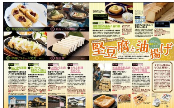
<「堅豆腐と油揚げ」誌面>