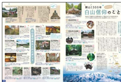
&lt;パンフレット代表誌面&gt;