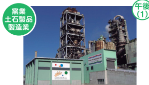
窯業土石製品製造業 敦賀セメント株式会社 敦賀市泉2号6番地1

敦賀港を拠点とした海上物流やトラック・バス・タクシーでの陸上輸送を展開する総合物流企業です。