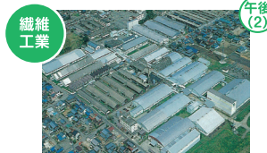
繊維工業 松文産業株式会社 勝山市旭町1-1-56

表面処理を主体とし、資材調達から加工・組付までの一貫生産にて自動車部品を製造しています。