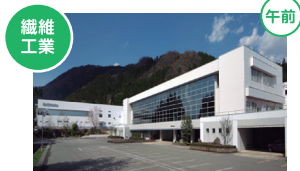
繊維工業 株式会社ニットク 勝山市片瀬10-1

当社の繊維製品は、電子部品、建築土木、環境等、数多くの産業分野で使用されています。