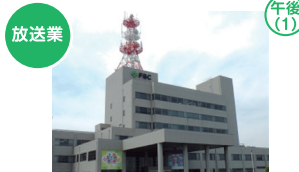
放送業 福井放送株式会社 福井市大和田2-510

「ごまどうふ」を柱に「ヘルシーで上質な本物志向の食品」の提供を通じて、「健康と幸せ」を追求しています。