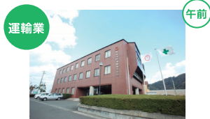
運輸業 敦賀海陸運輸株式会社 敦賀市桜町2-10

敦賀港を拠点とした海上物流やトラック・バス・タクシーでの陸上輸送を展開する総合物流企業です。