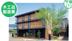
木工品製造業 有限会社山口工芸(Hacoa) 鯖江市西袋町503

木の温もりを感じさせるものづくりを、デザインから製作まで、販売まで一貫して行うプロフェッショナル集団。