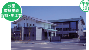
公園遊具施設設計・施工業 株式会社ジャクエツ 敦賀市若葉町2-1770

創業80年を超える老舗セメント製造会社で各種セメント・地盤改良材等の製造販売をしています。