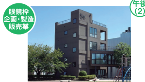
眼鏡枠企画・製造販売業 株式会社ポストクラブ 鯖江市三六町1-4-31-2

木の温もりを感じさせるものづくりを、デザインから製作まで、販売まで一貫して行うプロフェッショナル集団。