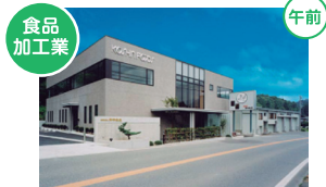
食品加工業 有限会社幸伸食品 吉田郡永平寺町諏訪間33-15

「ごまどうふ」を柱に「ヘルシーで上質な本物志向の食品」の提供を通じて、「健康と幸せ」を追求しています。