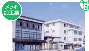
メッキ加工業 清川メッキ工業株式会社 福井市和田中1-414

テレビ・ラジオのメディアを通して、「こころ豊かな福井」の実現に貢献する放送局です。