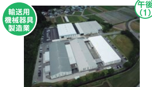
輸送用機械器具製造業 株式会社フクタカ 勝山市遅羽町大袋61-35

当社の繊維製品は、電子部品、建築土木、環境等、数多くの産業分野で使用されています。