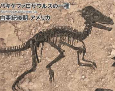
パキケファロサウルスの一種 Pachycephalosaurus 白亜紀後期 アメリカ