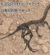
ヒパシロフォドン・フォクシイ Hypsirodon foxleyi 白亜紀前期 イギリス