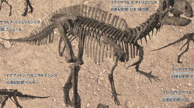
フクイサウルス・テトリエンシス Fukuisaurus tetraensis 白亜紀前期 日本 (福井県)