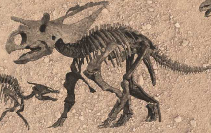
アルバータケラトプス・ネスモイ Albertaceratops nesmoi 白亜紀後期 アメリカ