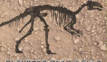
マンテリサウルス・アセルフィルデンシス Mantellisaurus aselphi 白亜紀前期 イギリス