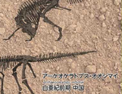
アーケオケラトプス・オオシマイ Archaeoceratops ooshimai 白亜紀前期 中国