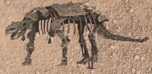
ヒバクロサウルス・ステピンケリ Hesperosaurus stephenseni 白亜紀後期 アメリカ