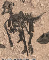
カンプトサウルスの一種 Camptosaurus ジュラ紀後期 アメリカ