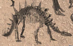
トゥオジャンゴサウルス・マルチスピナス Tuojiangosaurus marchospinus ジュラ紀後期 中国