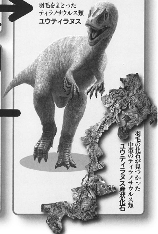
羽毛の化石が見つかった 中型のティラノサウルス類 ユウティラヌス産化石