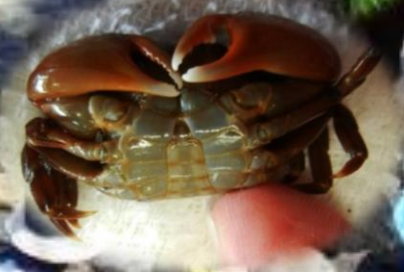
採集できた生きものを観察し、解説を行います。