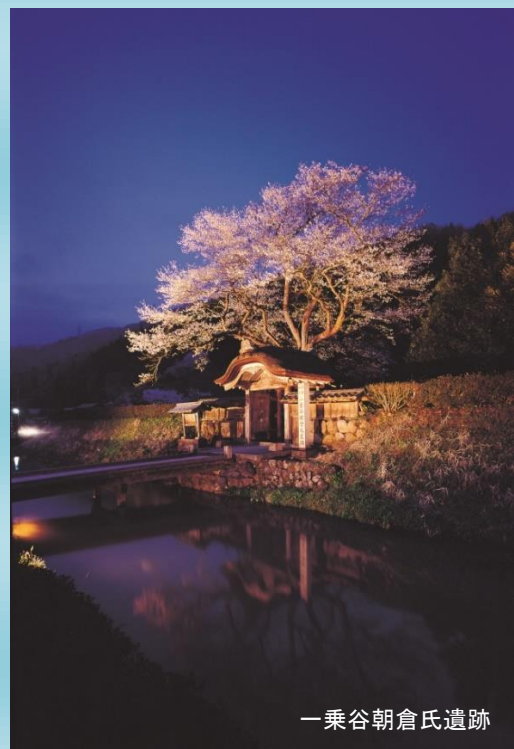
一乗谷朝倉氏遺跡