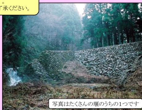
写真はたくさんの堰のうちの1つです

当日は2班に分かれてマイクロバスで山道を上っていき、歴史ある遺産(堰)を見学していただく予定です。見学をしていない班は、その間リトリートたくらでそば打ち体験をお楽しみください。