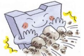
ぼくたち堰は、山の土砂が住宅地に押し寄せるのを防いでいるんだよ