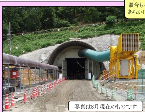
写真は8月現在のものです

小浜～敦賀間約50kmの区間の完成に向け、嶺南地域の至るところで大規模な工事が進められています。当日は、まだ貫通していないトンネルの中を探検し、どのような工事が行われているのかを学んでいただく予定です。