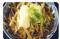
そば打ち体験 自分で打ったそばは最高の味? お弁当は少なめが良いかも?