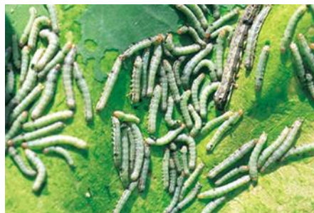
図3 ハスモンヨトウ幼虫（老齢幼虫 4 cm）