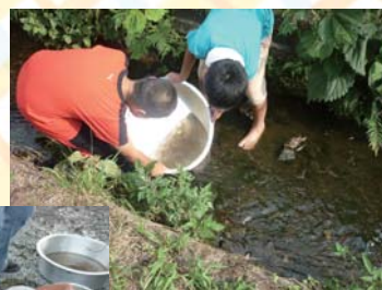
田んぼで育ったコイ・フナの計測と水路への放流