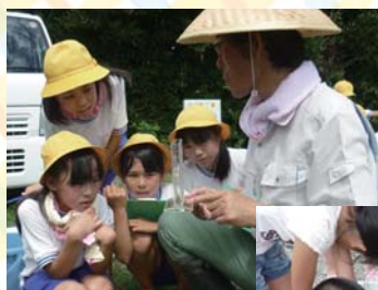
田んぼの生きもの観察

4年目の取組となる今年は、採卵のためのシュロづくりから始めました。田植えの日に卵の付いたシュロを田んぼに投入したところ、今年は約 1,250 匹のフナと約 300 匹のコイが、ゆりかご水田で育ちました。