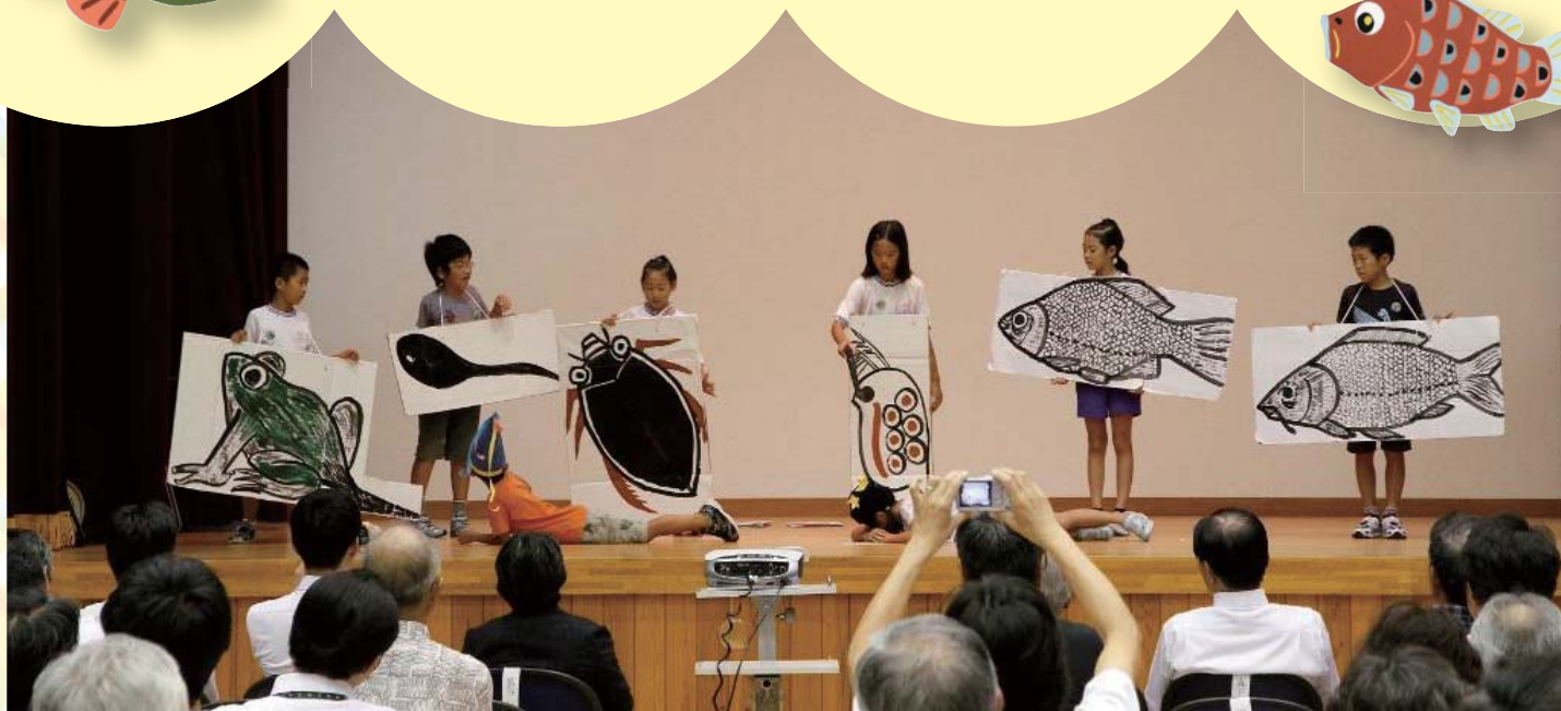
三方五湖自然再生フォーラムでの発表（平成 24 年度）

三方小学校では、校区の方から借りた田んぼを「ゆりかご水田」と名付け、全校児童によるお米づくりと、田んぼでのコイ・フナの子魚育成に取り組んでいます。