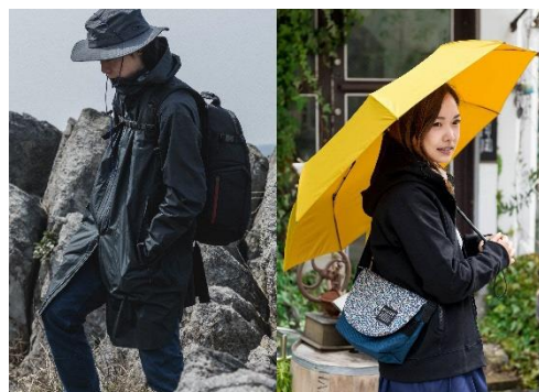
Lifestyle × Outdoor Ga-Mant [ 2.5L Rain Wear ] Nu-Rain [ Automatic Folding Umbrella ]

また、自社オリジナルレインブランドを立ち上げ、県内合成繊維織物を活用した超撥水の折り畳み傘やレインコートなどを開発・販売している。