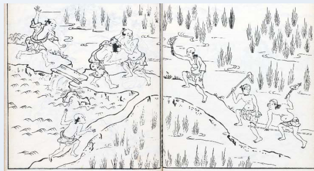
水あらいの図 部分[大和耕作絵抄](国会図書館蔵)

江戸時代の人々にとっても、川の水は生活、とくに食料や年貢に直結する農業に欠かせませんでした。川の水は有限であり、ときには水をめぐる争いが村々で起こりました。彼らはどのように争い、そして和解したのでしょうか？ 県下最大の農業用水である十郷用水を中心に、人々の水争いに迫ります。