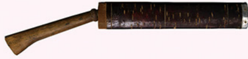
ナタ（桜皮製さや付）