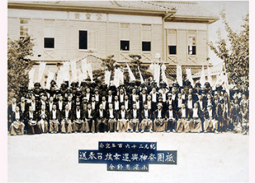
紀元 2600 年記念小浜有終会集合写真