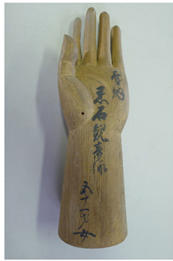
三方石観世音手形・足形等奉納品（三方石観世音蔵） （画像提供 福井県教育委員会）