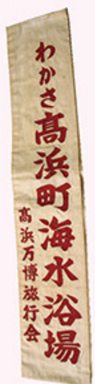
たすき（高浜町海水浴場広告）