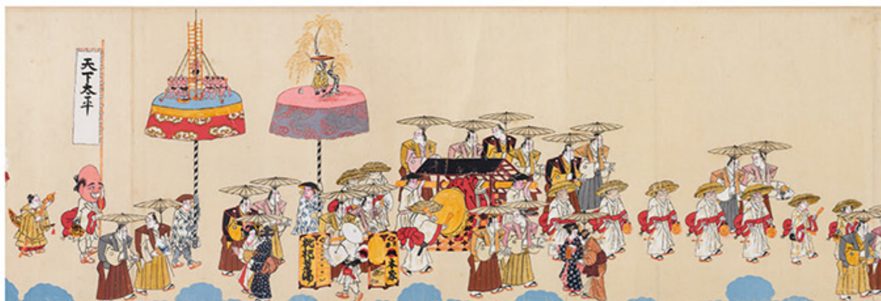
紙本著色 小浜祇園祭礼図（広嶺神社蔵 当館寄託）