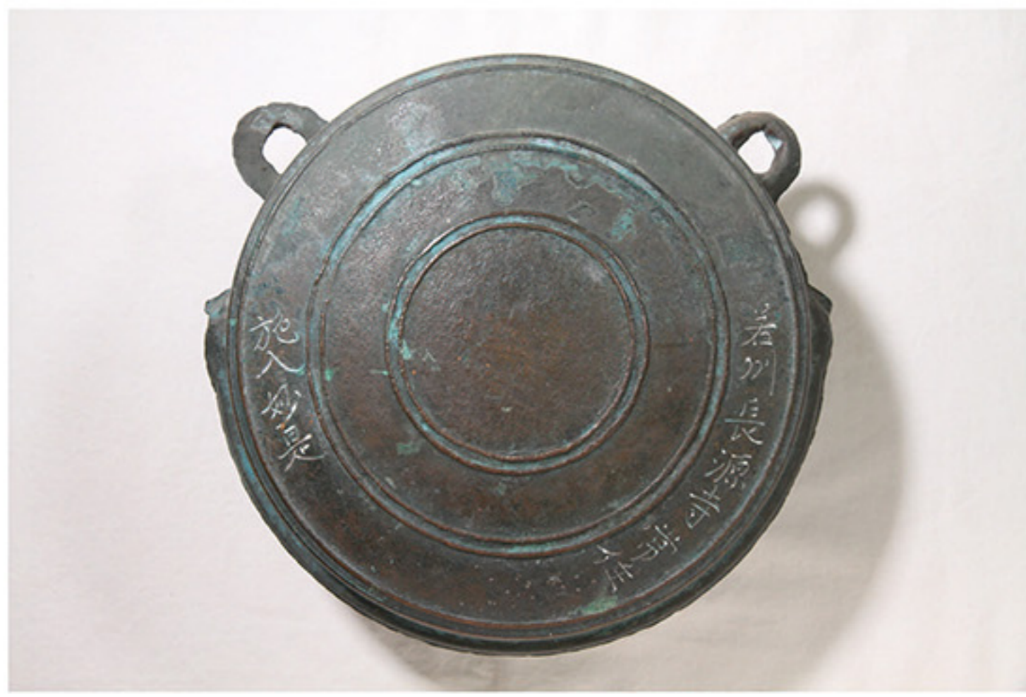
銅罌口（長源寺蔵）