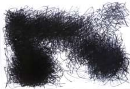
作品 900×1200（cm） 印刷紙、油性ペン 2017年