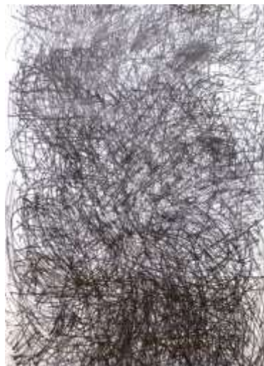
作品 1100×1500（cm） ロール紙、油性ペン 2021年