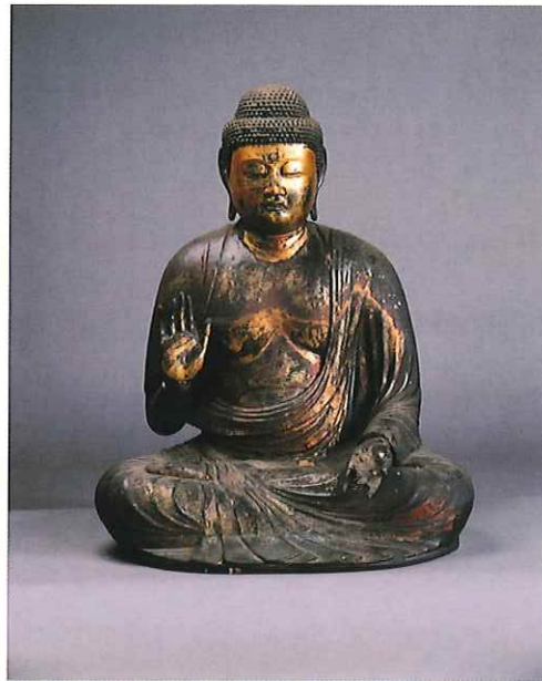
木造釈迦如来坐像 慈眼寺蔵／平安時代 【若狭町指定文化財】