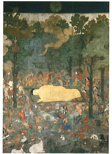
仏涅槃図 谷田寺蔵／鎌倉時代 【福井県指定文化財】 (展示期間：5月11日～6月2日)