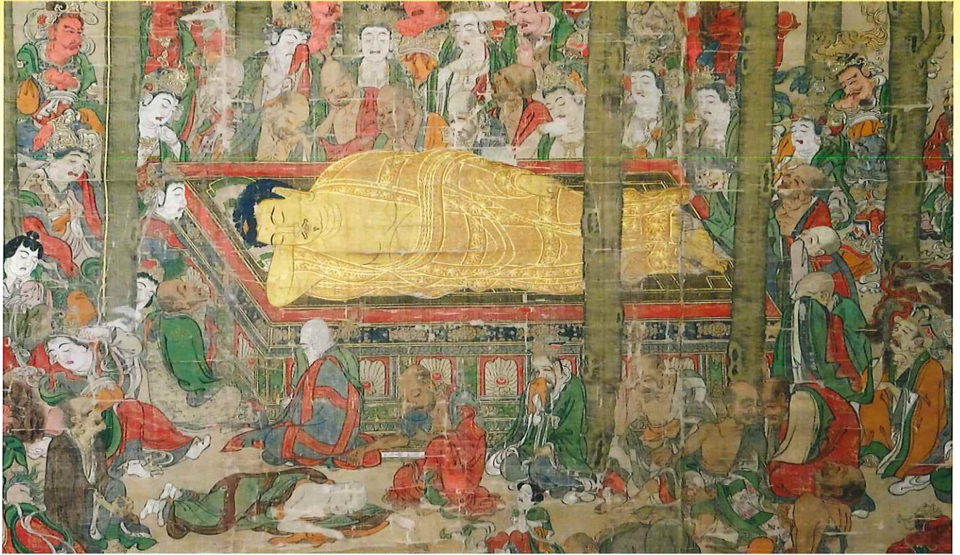
仏涅槃図（羽賀寺蔵／南北朝時代）【福井県指定文化財】