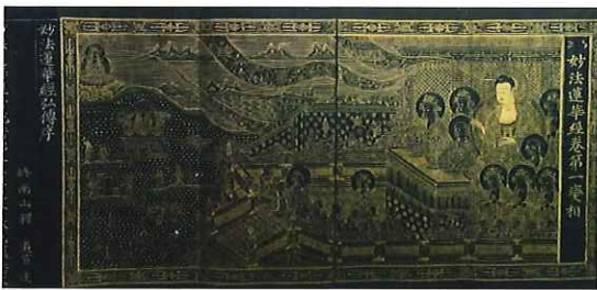
紺紙銀泥法華経 羽賀寺蔵／高麗時代 【福井県指定文化財】