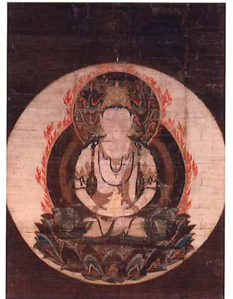
弥勒菩薩像 萬徳寺蔵／鎌倉時代 【重要文化財】 (展示期間：4月18日～5月10日)