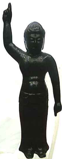
誕生釈迦仏立像(複製)

前期(4月18日(木)～5月10日(金))・後期(5月11日(土)～6月2日(日))で一部展示品の入れ替えを行います。