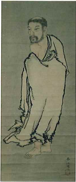
出山釈迦図 雲外寺蔵／江戸時代

仏教美術の基本ともいえる釈迦如来の造形について、若狭に伝来する文化財からご紹介します。