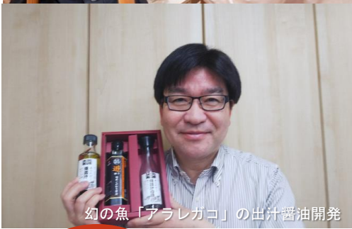
幻の魚「アラレガコ」の出汁醤油開発