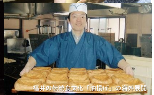
福井の伝統食文化「油揚げ」の海外展開