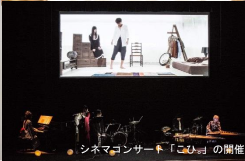
シネマコンサート「こひ」の開催