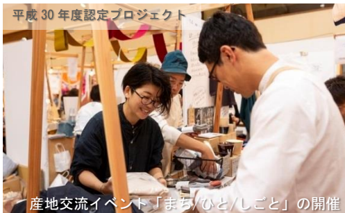
産地交流イベント「まち/ひと/しごと」の開催