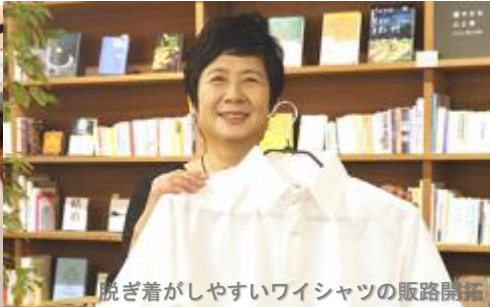
脱ぎ着がしやすいワイシャツの販路開拓