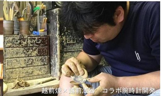
越前焼×越前漆器 コラボ腕時計開発