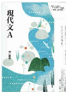
日本の高校国語教科書 「現代文A」東京書籍 2013(平成25)年