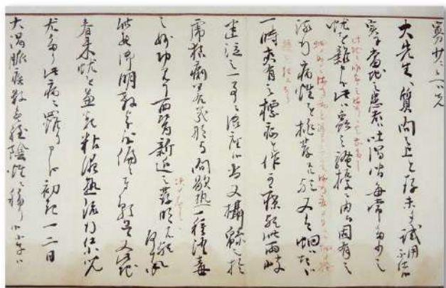
緒方洪庵宛 藤野升八郎書状(洪庵朱筆入り)(複製) 大阪大学適塾記念センター蔵