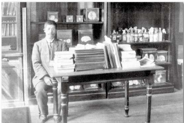
藤野巖九郎 仙台医学専門学校 教室にて 1913(大正2)年ごろ

今年、藤野巖九郎(1874-1945)の生誕150年にあたります。藤野は、坂井郡本荘村(現・あわら市)の医家に生まれ、愛知県立医学校(現・名古屋大学医学部)を卒業、医師となりました。仙台医学専門学校(現・東北大学医学部)の教授時代に、清からの留学生として来日した周樹人(後の文学者魯迅)を懇切丁寧に指導し、魯迅から生涯の師と仰がれたことでも知られています。