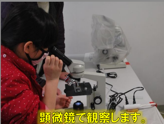
顕微鏡で観察します。