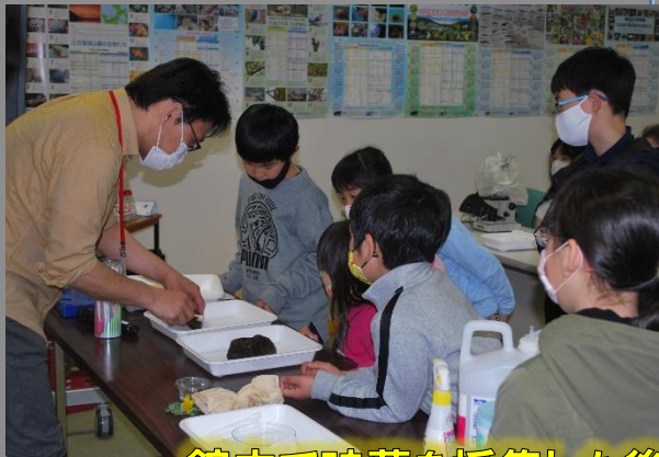
館内で珪藻を採集した後にプレパラートを作ります。