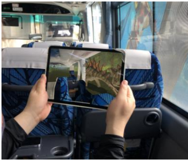
恐竜 AR 使用イメージ