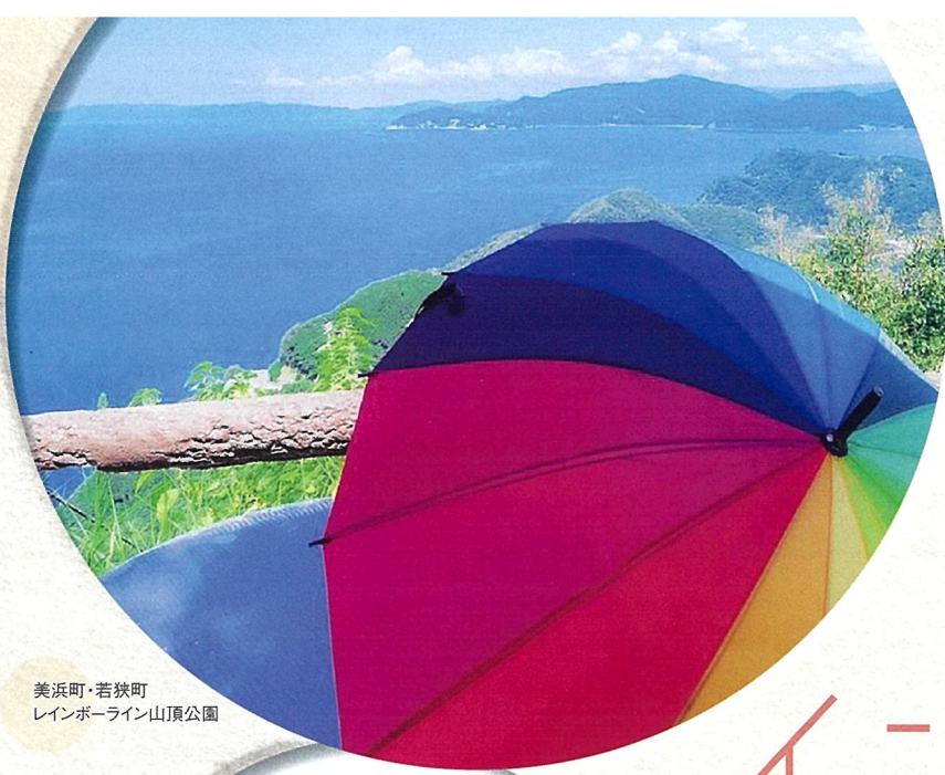
美浜町・若狭町 レインボーライン山頂公園