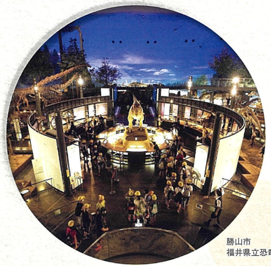
勝山市 福井県立恐竜博物館