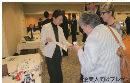
企業人向けプレゼン