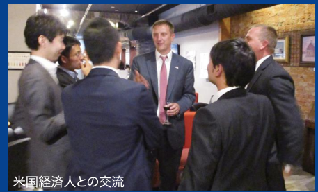
米国経済人との交流