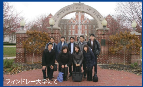
フィンドレー大学にて