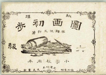
「新撰 図画初歩 六級」1880(明治13)年 平瀬著作の小学校用教科書

今回の企画展では、平瀬の心情を伝える南方熊楠にあてた書簡、若き日(20歳代)の平瀬の写真などの初公開資料や、新たに発見された平瀬の著作教科書等を通し、様々な角度から平瀬の研究の再評価とその生涯について紹介します。