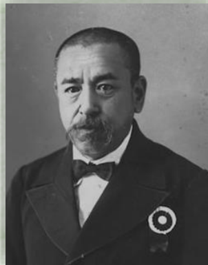
平瀬と共同研究を行った南方熊楠