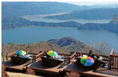
レインボーライン山頂公園

レインボーライン山頂公園では、5色の湖といわれる三方五湖を望む絶景を楽しむ、足湯につかって日ごろの疲れを癒しませんか？「きいばす」では、様々なエネルギーに関する体験ができます。大人も子供もお楽しみいただけます！