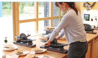
健康ブレンド茶づくり