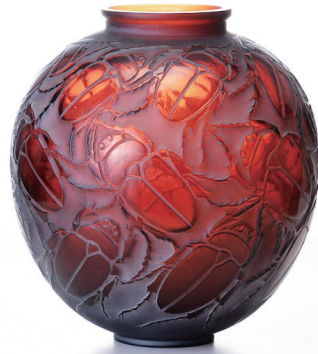
ルネ・ラリック 花器「スカラベ」1923年 箱根ラリック美術館蔵