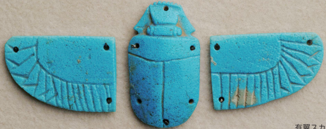
有翼スカラベ 古代エジプト末期王朝、第26～30王朝 古代エジプト美術館 渋谷蔵

夏休みに嶺南美術展を開催する若狭歴史博物館の観覧と、嶺南地域の文化施設やニュースポットを巡るバスツアーです。この夏、ご家族、ご友人と嶺南地域を旅してみませんか。