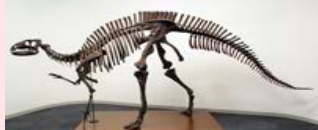
フクイサウルス(全長約4.7m)