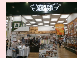
場所: 東急ハンズ2階 サザンテラス口店舗内