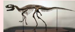
フクイラプトル全身骨格 (全長約4.2m)