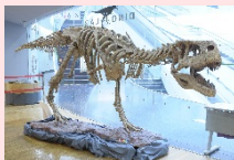
アウカサウルス(全長約5.6m)