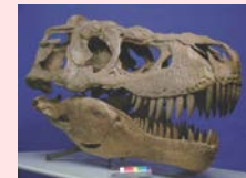
タルボサウルス頭骨 (全長約1.4m)