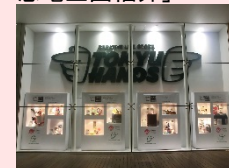
場所: 東急ハンズ2階 ショーウィンドウ内