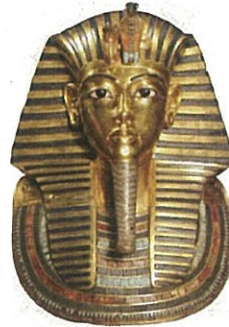
ツタンカーメンの黄金のマスク (レプリカを展示)

展示は2つのテーマで、三方湖の畔に隣接する年縞博物館と縄文博物館にて同時開催。第1部では、気候変動と王朝盛衰の関係、第2部では、ナイル川での人々の生活や精神世界に迫ります。古三方湖畔の縄文人との比較展示も見所です。