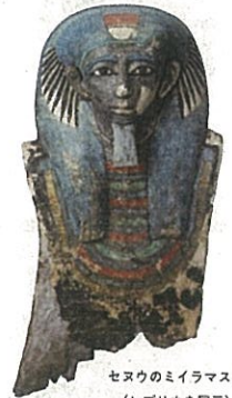
セヌウのミイラマスク (レプリカを展示)