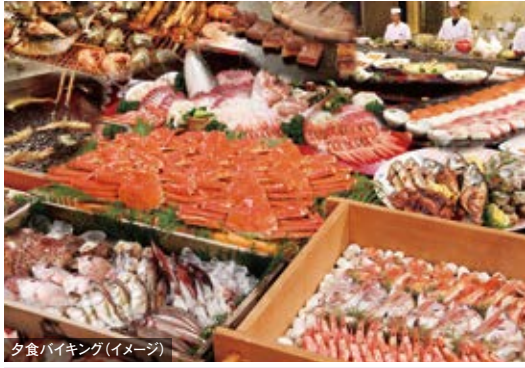
夕食バイキング(イメージ)