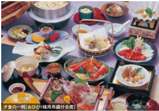
夕食の一例(おひとり様用舟盛付会席)