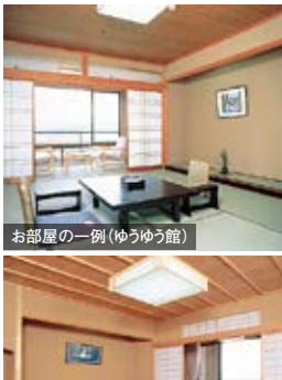
お部屋の一部(ゆうゆう館)