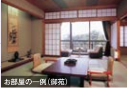
お部屋の一部(御苑)

「御苑」にお部屋グレードアップ 水曜日限定 追加代金なしで客殿から御苑へ客室グレードアップ!! おとな(こども)おひとり様 2,400(1,700)円増 夕食は食事処でおひとり様用舟盛付会席 さらに1,200(700)円増 夕食はお部屋でおひとり様用舟盛付会席