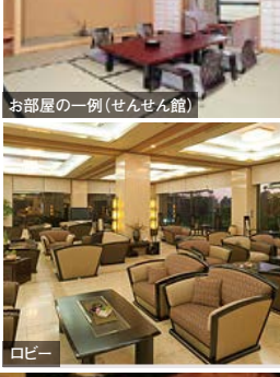
お部屋の一部(せんせん館)