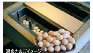
温泉たまごイメージ