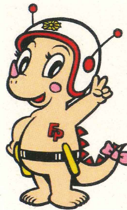
リューミーちゃん