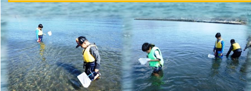
小型の地引網やタモ網で 生きものを採集します。