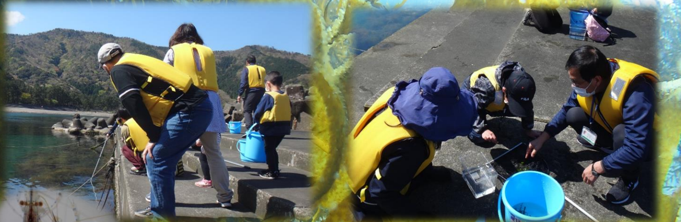
タモ網を使って海藻の中の生きものをすくいます。