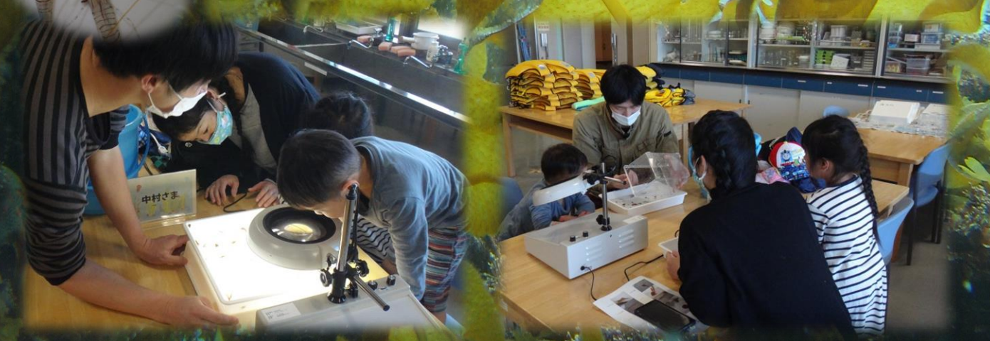
採集できた生きものを観察します。