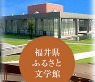
福井県 ふるさと 文学館