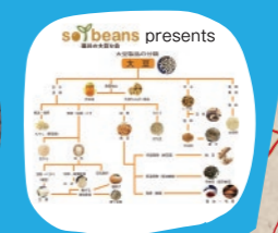
協力: 味の素食の文化センター