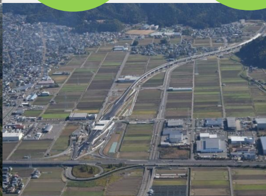
●中部縦貫自動車道(整備中)