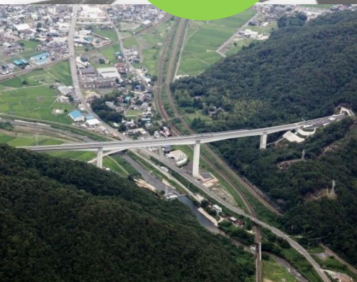
●舞鶴若狭自動車道(平成26年7月全線開通)