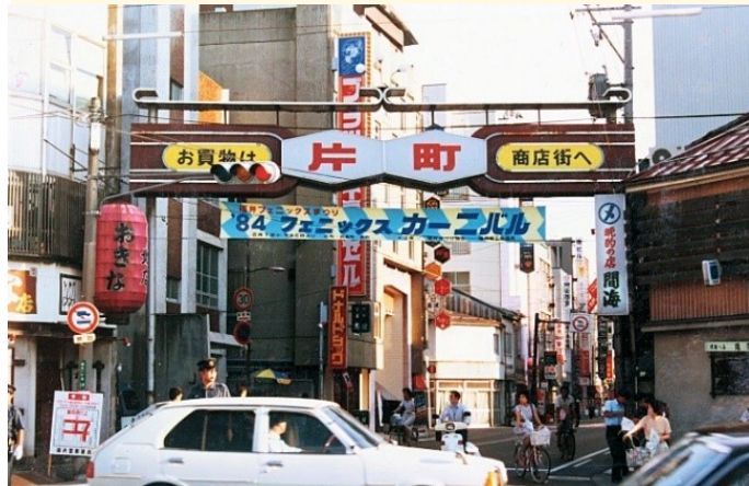
片町商店街 新栄商店街