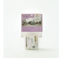
胡麻豆腐のすいーつ