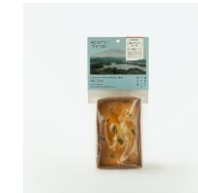
梅パウンドケーキ