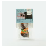
敦賀しよらオレンジ