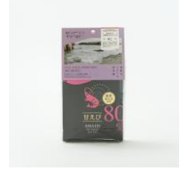
越前甘えび唐揚げせんべい