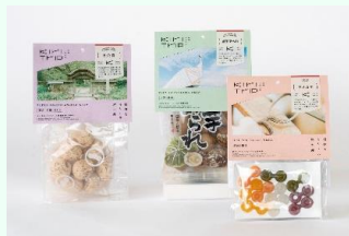
キリトリップどれか3商品 5名様