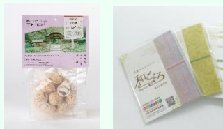
キリトリップどれか1商品 と越前和紙マスクケースのセット 10名様