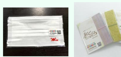
マスク (かにシールつき) と越前和紙マスクケースのセット 30名様

ホームページ： http://www.fuku-e.com/kiritrip Instagram：@kiritrip_fukui フェイスブック：@kiritripfukui (にて) キリトル福井の情報を随時お届け中！