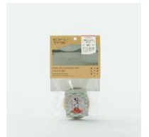
梅たっぶりゼリー

福井県の最も南西部、美しい海や山に囲まれた自然豊かな地域。さまざまなアクティビティを楽しめるだけでなく、古代から都の食文化を支えてきた歴史や若狭塗箸などの伝統工芸もあり、受け継がれてきた文化が今も息づいています。