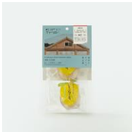
幸せの小さな レモンケーキ