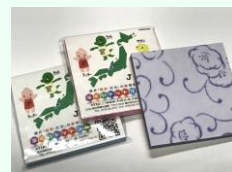
越前和紙メモパッド