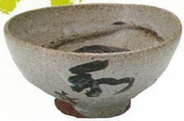
絵唐津茶碗 [岡山県立美術館蔵]