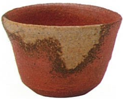
信楽酒盃 [岡山県立美術館蔵]