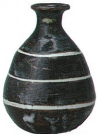
黒地白筋文徳利 [岡山県立美術館蔵]