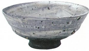
刷毛目茶碗(銘 白雲) [岡山県立美術館蔵]