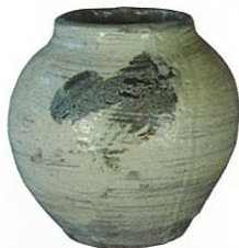
刷毛目壺 [喜多村作太郎作、福井県陶芸館蔵]

小山富士夫(1900-1975)は、「越前焼」の名付け親であるとともに、「越前焼」古窯跡の調査を行い、「越前焼」を「日本六古窯」の1つに位置付けるなど、「越前焼」研究・振興に大きな功績を残した。