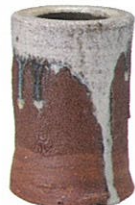
朝鮮唐津掛花生 [岡山県立美術館蔵]