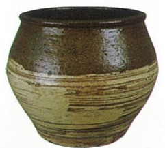
刷毛目花生 [喜多村作太郎作、福井県陶芸館蔵]