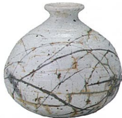
粉引搔落瓶 [岡山県立美術館蔵]