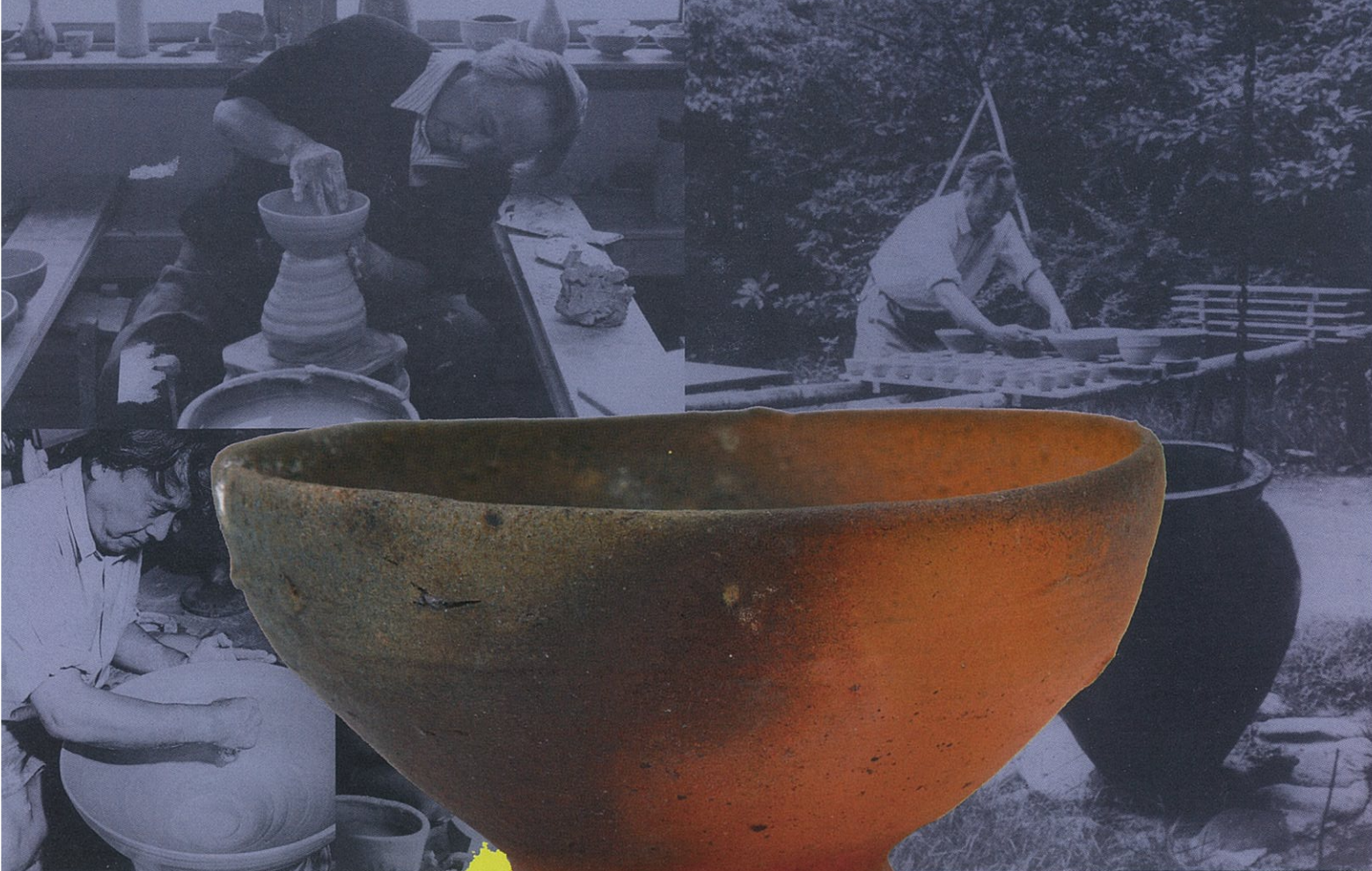
種子島茶碗(銘 晩鐘) [岡山県立美術館蔵]