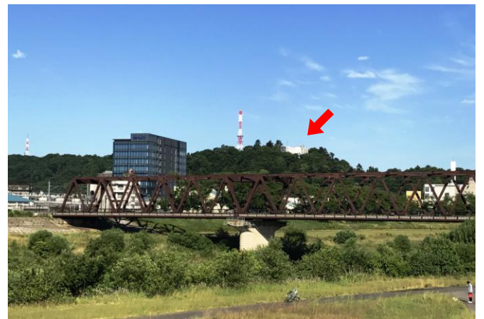
福井市街から望む