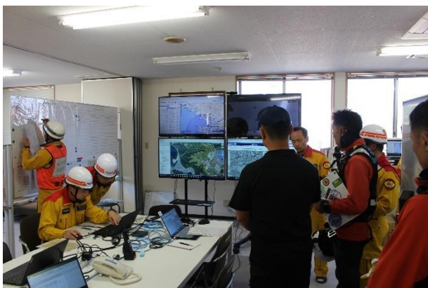
緊急消防援助隊近畿ブロック合同訓練