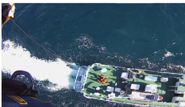
巡視艇あさぎり連携訓練