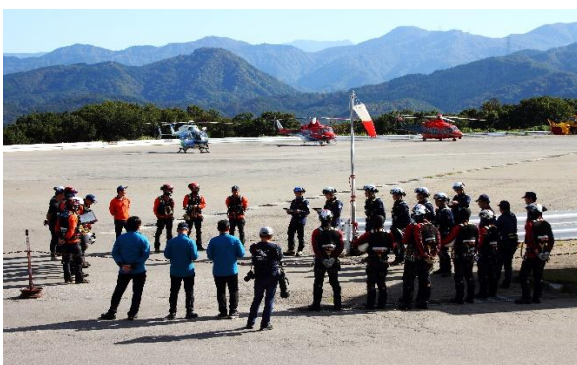
北陸三県合同訓練