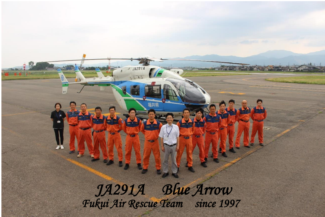
JA291A Blue Arrow Fukui Air Rescue Team since 1997