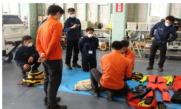
富山県消防防災航空隊視察