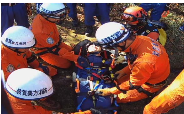
消防隊員との連携訓練