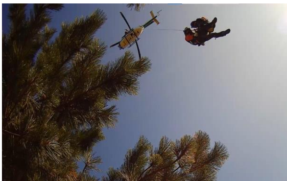
自隊訓練（山岳救助）