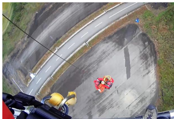
緊急消防援助隊中部ブロック合同訓練