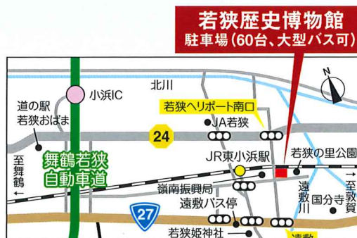
■自動車：舞鶴若狭自動車道 小浜ICから5分