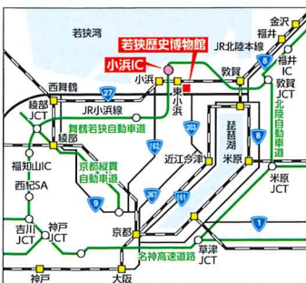
■JR小浜線 東小浜駅下車、東へ徒歩7分