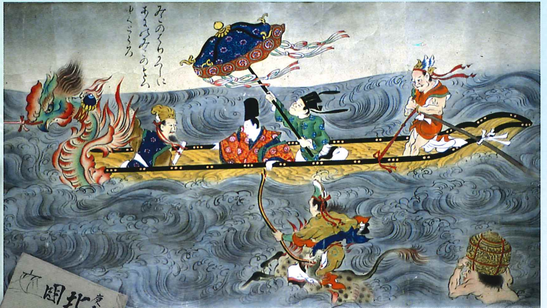
【県指定文化財】彦火火出見尊絵巻(模写本 明通寺所蔵)

本展示は日本遺産「荒波を越えた男たちの夢が紡いだ異空間～北前船寄港地・船主集落～」追加認定記念のテーマ展です。