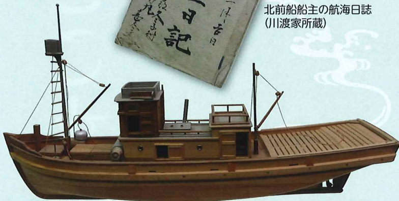
鯖巾着網漁船 模型(個人所蔵)