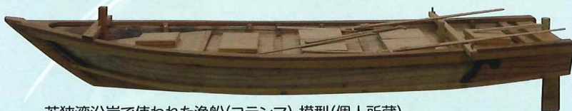
若狭湾沿岸で使われた漁船(コテンマ) 模型(個人所蔵)