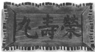
船額「榮寿丸」(当館蔵)