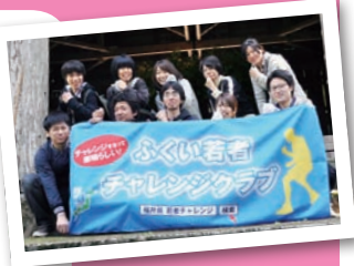
平成25年度 じじぐれ祭 応援隊メンバー

5月5日のじじぐれ祭に参加してくれる若者(じじぐれ祭応援隊員)を募集しています。 募集資格は、18~35歳の福井県ゆかりの若者なら、どなたでもOKです。