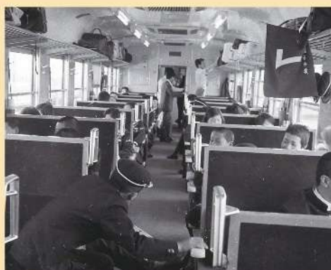
集約列車の中(坂井市立丸岡中学校 S46)

今回の企画展では、明治時代から現代まで、福井の児童・生徒が体験した修学旅行についてご紹介します。