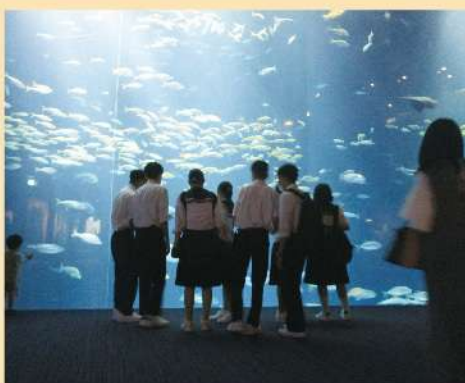
水族館班列行動(おおい町立名田庄中学校 R4)