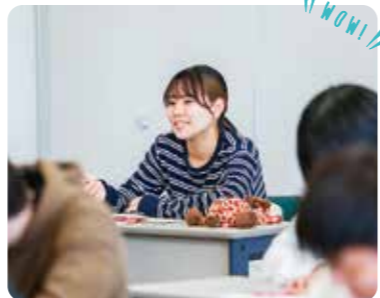
理学療法科3年制・介護福祉科2年制の最短カリキュラムかつ、全国平均を上回る国家試験合格率!