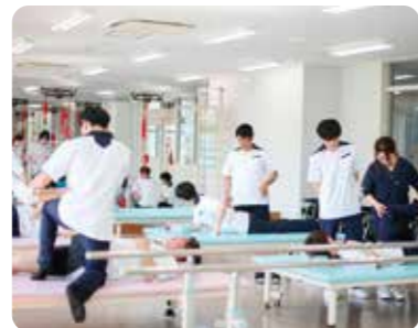
授業・実習は、経験豊富な講師陣による少人数制を採用。一人ひとりと合わせた個別指導も行います。