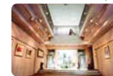
多くのアート作品に囲まれながら感性を磨き、企画・発想・提案力がアップ!