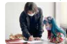
実社会と時代に即したカリキュラムにより、ファッション力を身に付けます。