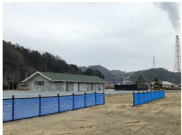
防砂ネット設置状況