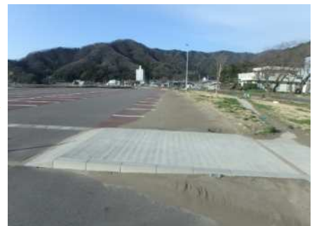
駐車場への飛散状況