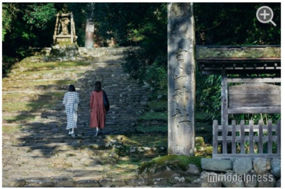
参道は長く、足場も苔で滑りやすいので、歩きやすい格好で訪問すると◎。

歴史を知るほど、当時の栄華がひっそりと佇んでいるようで、さらに神秘的な場所に感じられるでしょう。平泉寺の参道は、コースによっては40分～80分とあり、梅雨の時期や雨が降った後は足元が非常に滑りやすいため、歩きやすい恰好と靴で拝観をどうぞ。夏でもひんやり涼しい場所なので、一枚羽織ものがあると便利です。美しい緑の世界に包まれながら、非日常的な空間を楽しんで。