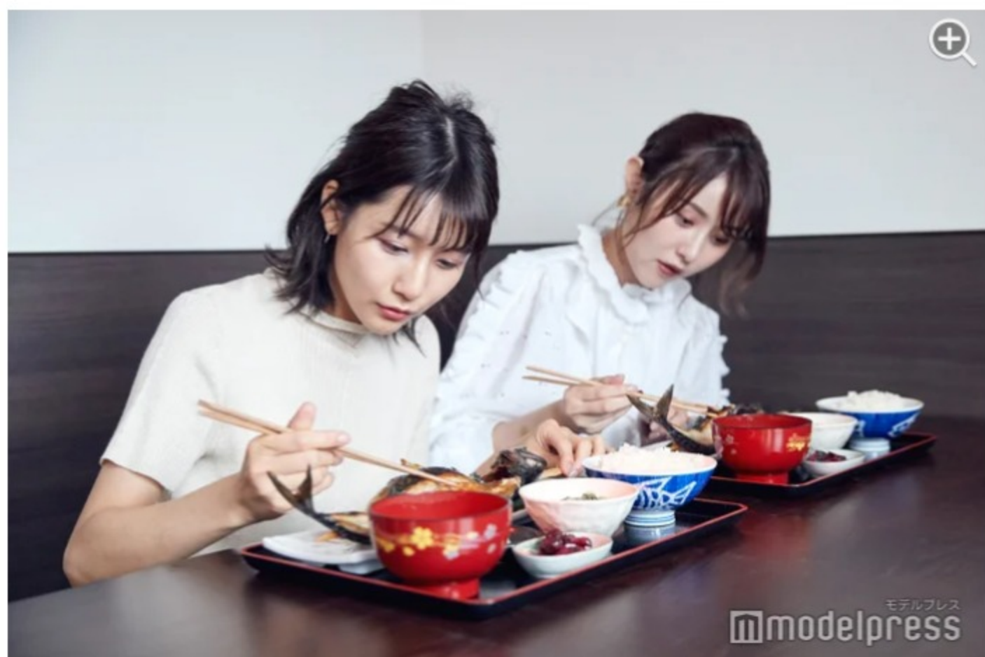
なかなか1枚丸ごと食べる機会がないので、インフルエンサーたちもびっくり。

1階には焼いた鯖がずらりと並び、地元の人たちが勢いよく「2枚！3枚！」と鯖を購入していきます。あっという間に売れていく鯖を見ていると、どれだけその鯖が美味しいのか想像できるほど。