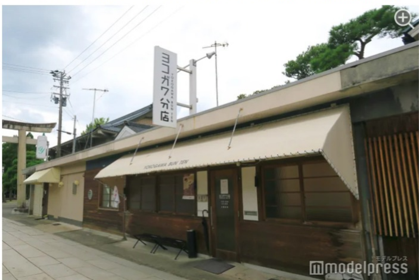
白と木目を基調としたオシャレな外観も必見！

ボルガライスとは、鶏肉と玉ねぎの入ったオムライスに、サクッと揚がった柔らかいとんかつが乗った、ボリューム満点な一皿。かかっている洋食ソースは特に美味しく、お店秘伝のものでレシピは企業秘密だそう。濃厚なデミグラスソースよりはあっさりしていて、ケチャップよりもコクがある、その絶妙な味は絶品！