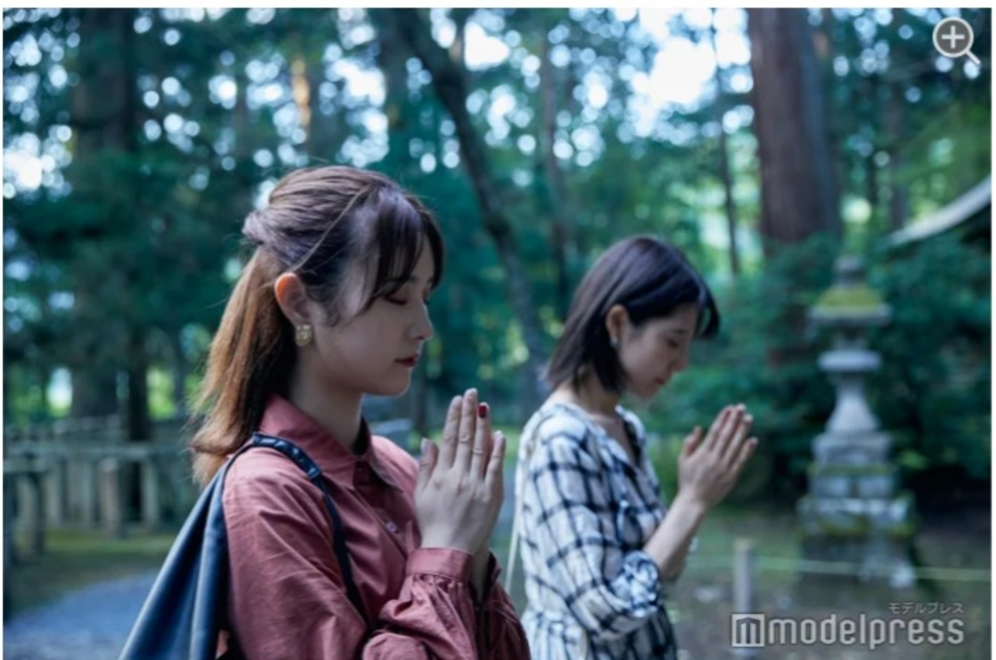
目を閉じると、栄華を誇ったその姿が浮かびます。

平泉寺は1300年程昔、霊峰白山の信仰拠点として開かれました。最盛期の戦国時代には、6,000の坊院が建ち並び、8,000人ももの僧兵が仕えていたそう。しかし1574年に焼失、その後一部復興されましたが、多くの坊院跡は失われ山林に埋もれてしまいました。時が経ち、平成元年に始められた発掘調査で、その歴史的価値・保存状態が認められ、旧境内全域が国史跡に指定されています。