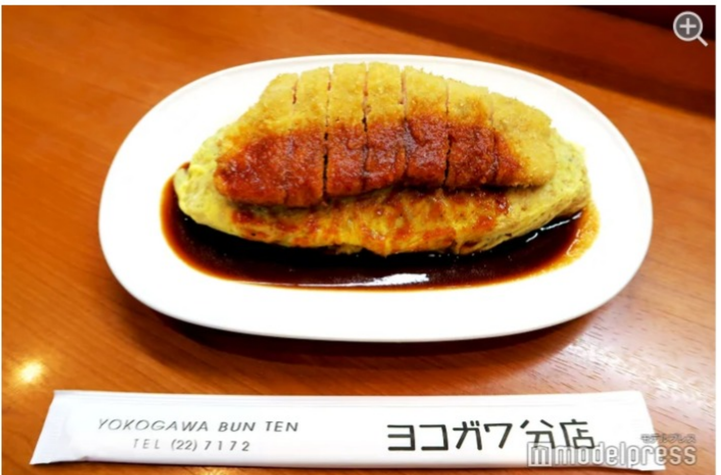
福井県越前市のご当地グルメ・ボルガライスと言えば、ヨコガワ分店！

■ 越前のご当地グルメ・ボルガライスの名店と言えば、老舗洋食屋の「ヨコガワ分店」！外にある可愛いタペストリーも必見