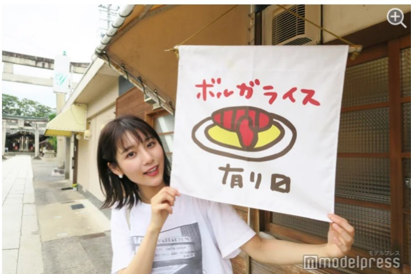
ヨコガワ分店

見た目は結構ガッツリ系ですが、実際食べてみると女性でもペロリといけてしまうほどあっさりしています。量もちょうどいいので、男性だったら大盛りでも良いかも。ボルガライスは約40年前から、お店の看板メニューとして親しまれてきた料理。長年愛されているのが分かる、食べ始めると止まらない味に思わず笑顔がこぼれます。