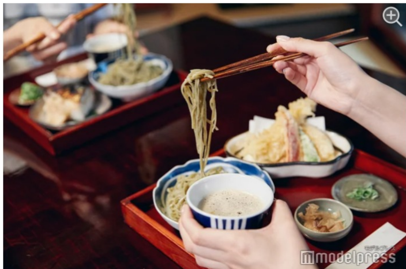
たっぷりの辛味大根が入ったおつゆでお蕎麦を頂きます。

美味しい元祖越前そばを食べるならここ。約160年続く歴史ある老舗蕎麦屋の「うるしや」です。お店は築100年以上にもなる建物を利用した、風情ある佇まい。中庭を眺めながら、静かな空間でゆっくりとお蕎麦を味わうことができます。