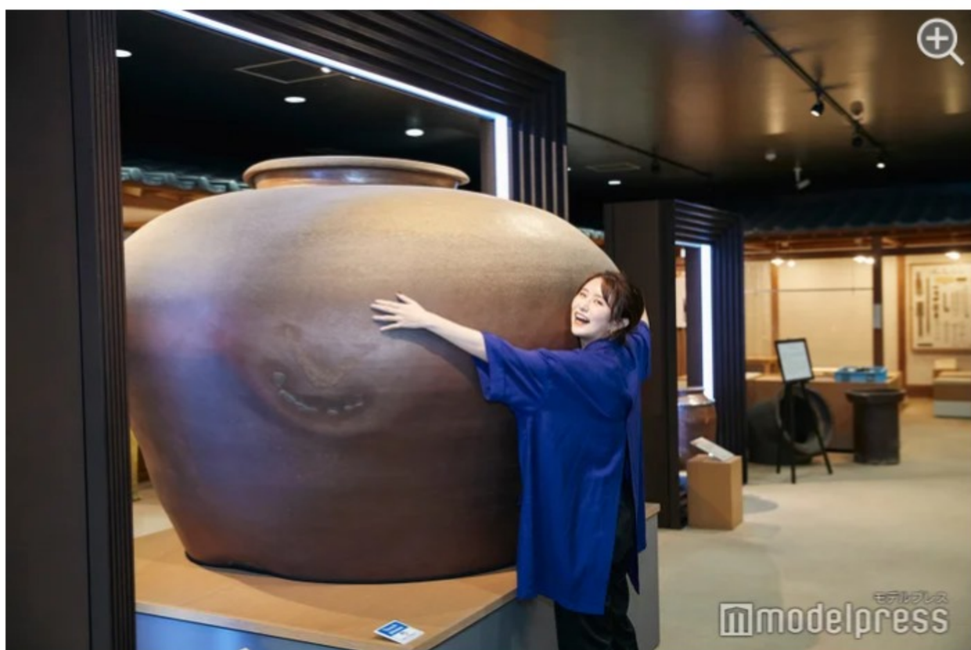
資料館にある大きな壺はインパクト抜群！

作品は焼き上げて完成するまでに約40日かかります（後日配送の場合は別途送料あり）。作って焼いて、完成して届くのが待ちきれない！自分で作った越前焼のカップを使って、お家で旅の思い出に浸るのも楽しいですね。