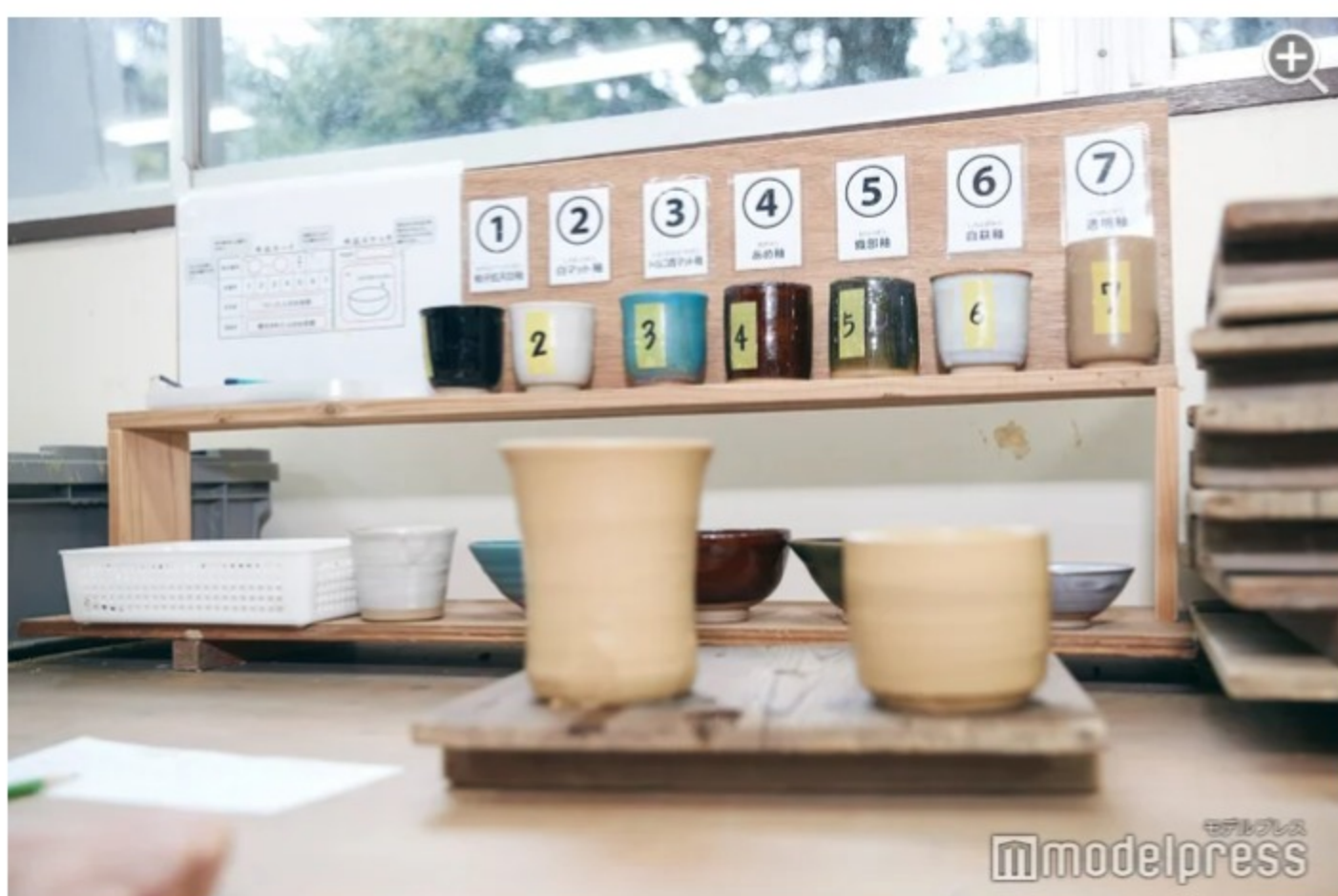
釉薬は7色から選ぶことが可能。どれも美しく迷ってしまう…。

今回は電動ろくろ体験でカップを作製。希望に合わせて形を作っていくので、何を入れて飲もうかと想像しながら作成するのも楽しい。釉薬の色は7色から選べます。