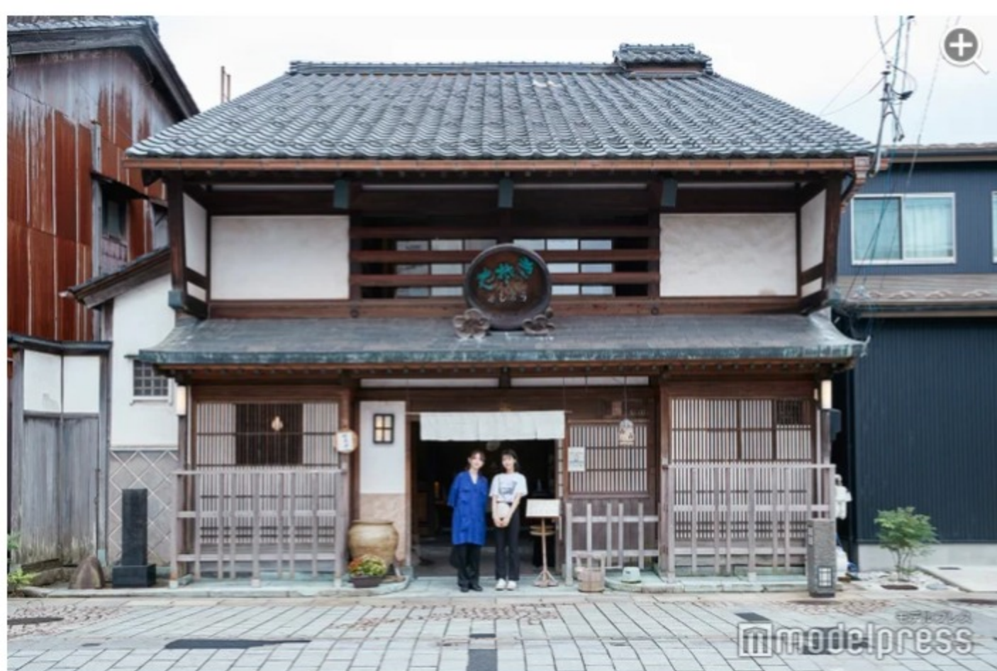
築100年以上経つ趣ある建物もまた素敵。