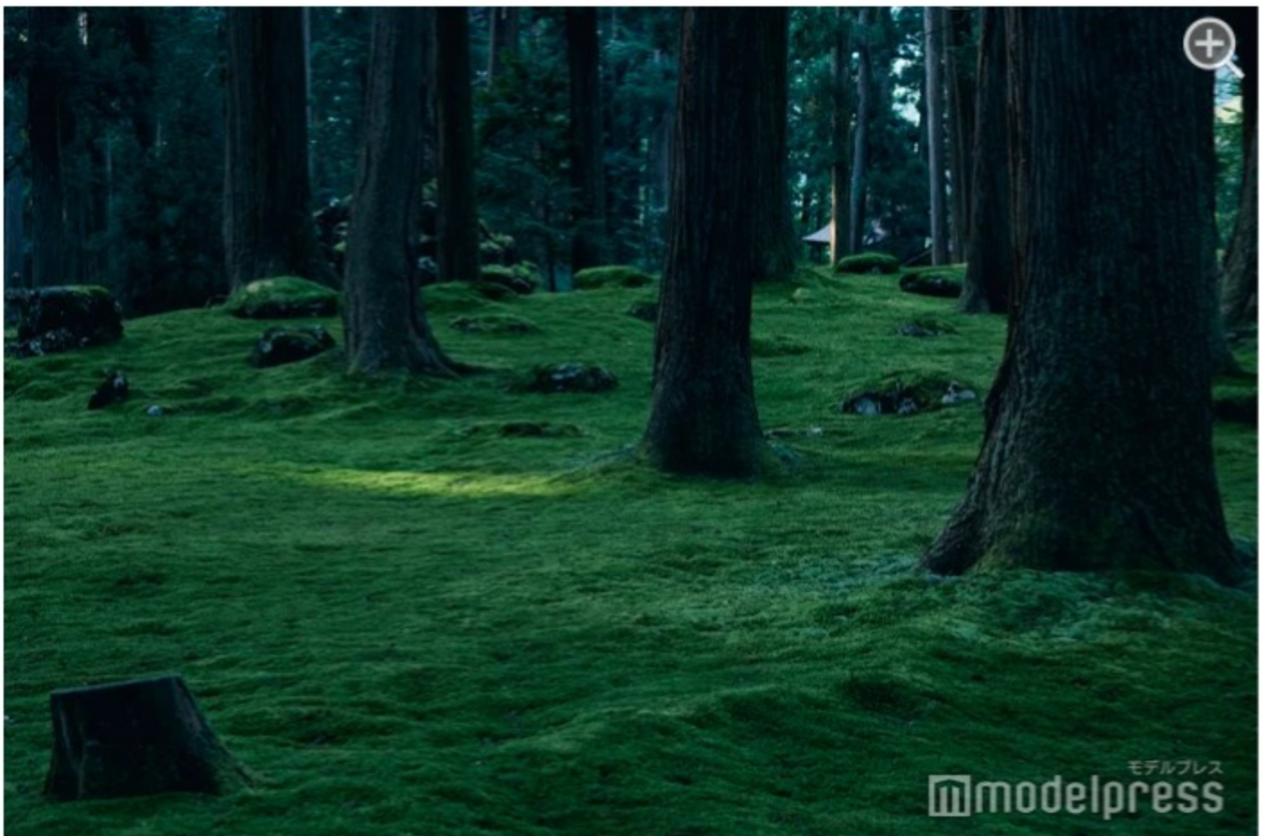
境内はひんやりしていて、夏でも涼しい。（C）モデルプレス

別名「苔宮」と呼ばれ、その名の通り境内は辺り一面緑のじゅうたん。静寂な雰囲気漂う中、林には木漏れ日が差し込み、深緑の美しい苔が広がっています。この神聖な空気を肌で感じに行ってみて。