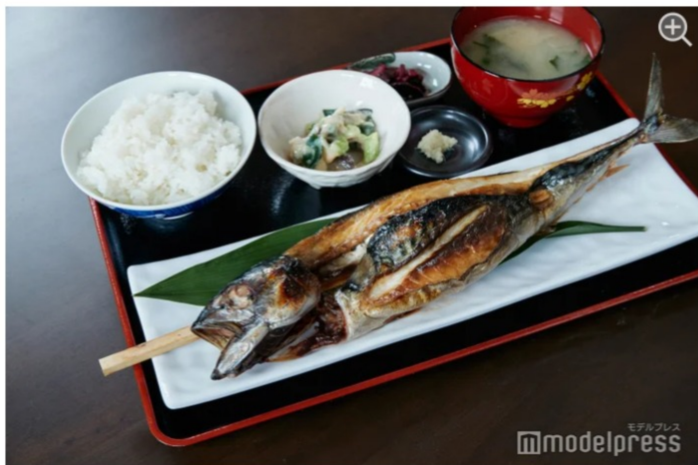
焼きたてホクホクの鯖定食！1枚丸ごとでもペロッといけちゃいます。

1階には焼いた鯖がずらりと並び、地元の人たちが勢いよく「2枚！3枚！」と鯖を購入していきます。あっという間に売れていく鯖を見ていると、どれだけその鯖が美味しいのか想像できるほど。