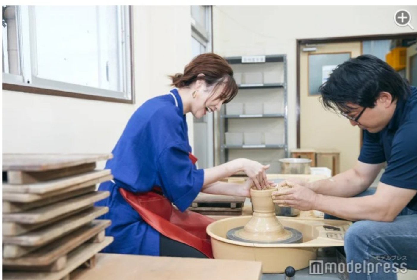
緊張しながらの制作…どんな越前焼ができるのか楽しみ！

今回は電動ろくろ体験でカップを作製。希望に合わせて形を作っていくので、何を入れて飲もうかと想像しながら作成するのも楽しい。釉薬の色は7色から選べます。