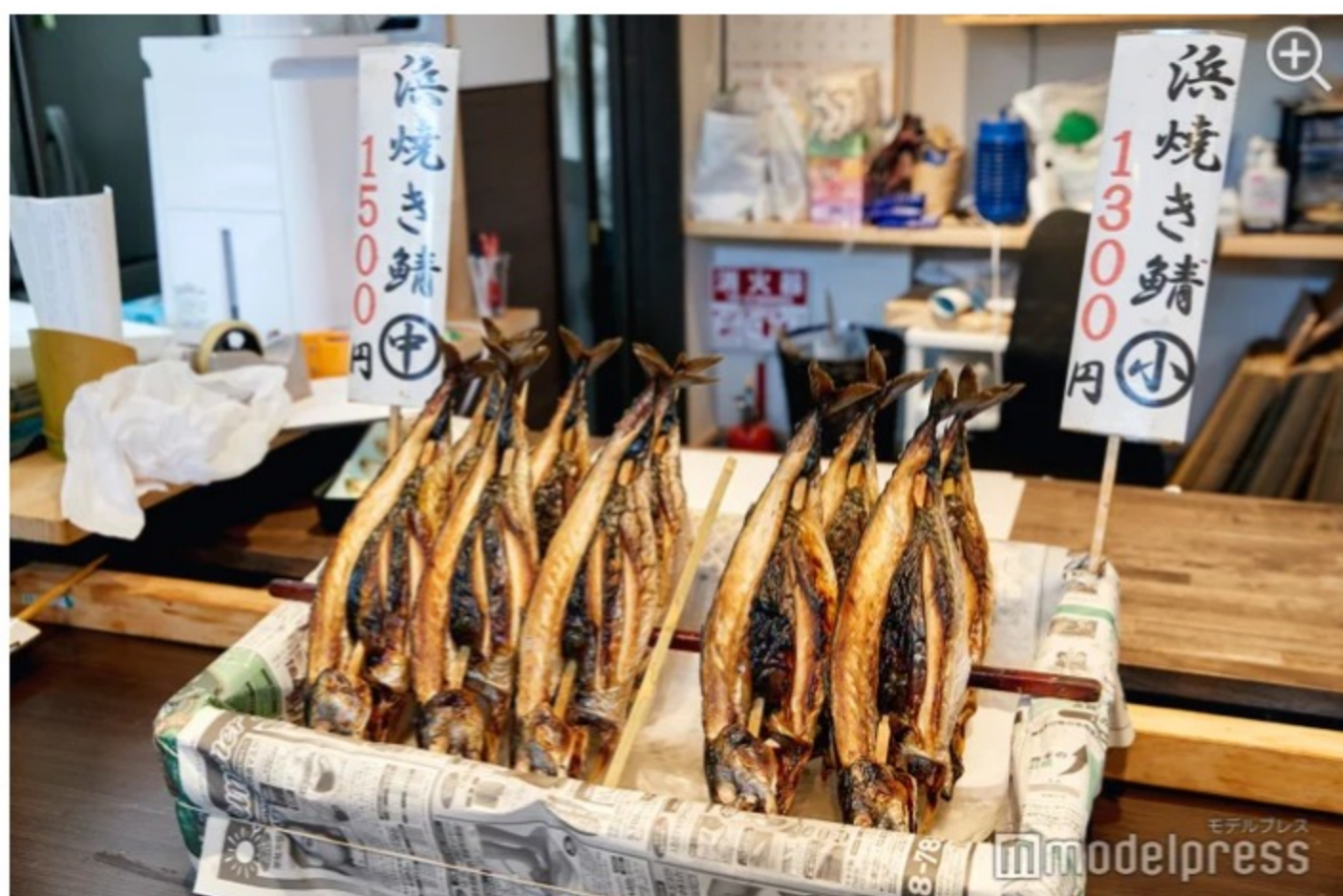
1階で売られている焼き鯖。見ているだけでヨダレが止まらない！

創業260年余にもなる元祖・鯖の専門店として有名な「朽木屋」は、京へ鯖を運んだ「鯖街道」に位置するお店です。「朽木屋」がある若狭小浜は、かつて飛鳥・奈良時代から朝廷へ海産物を提供する御食国（みけつくに）として栄えた場所。