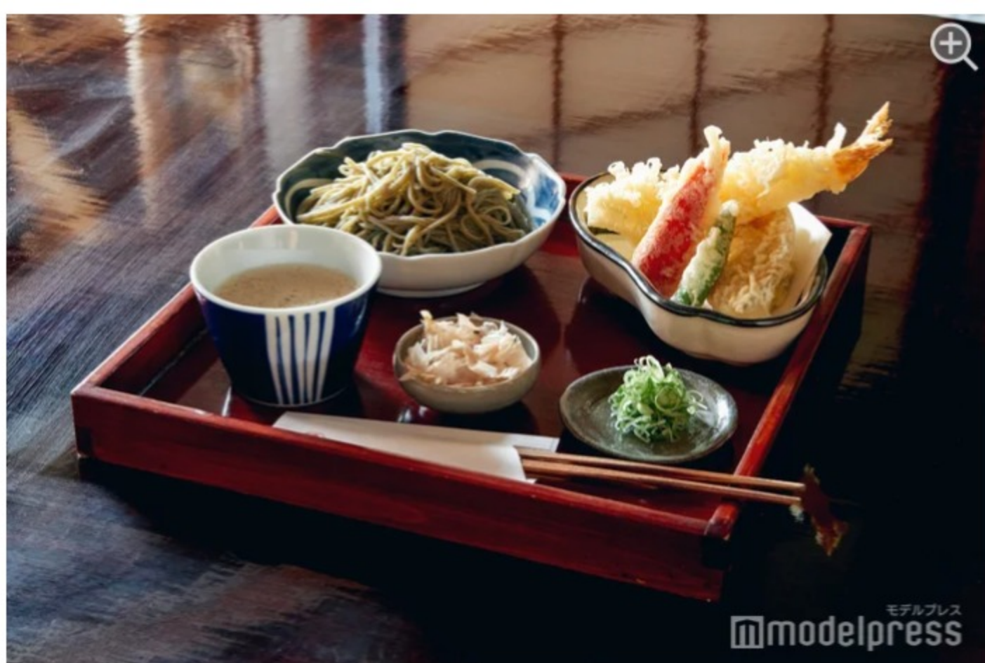
ランチ人気No.1の天ぷら盛りセット。

蕎麦つゆには辛味大根のおろし汁がたっぷり入っているのが越前そばの特徴。ツンとした辛さが癖になり、口に運ぶお箸の手が止まりません。