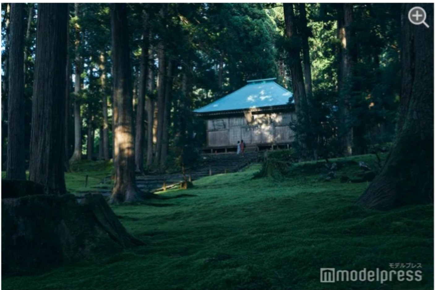
辺り一面緑のじゅうたん！まるで異世界に入り込んだよう。

別名「苔宮」と呼ばれ、その名の通り境内は辺り一面緑のじゅうたん。静寂な雰囲気漂う中、林には木漏れ日が差し込み、深緑の美しい苔が広がっています。この神聖な空気を肌で感じに行ってみて。