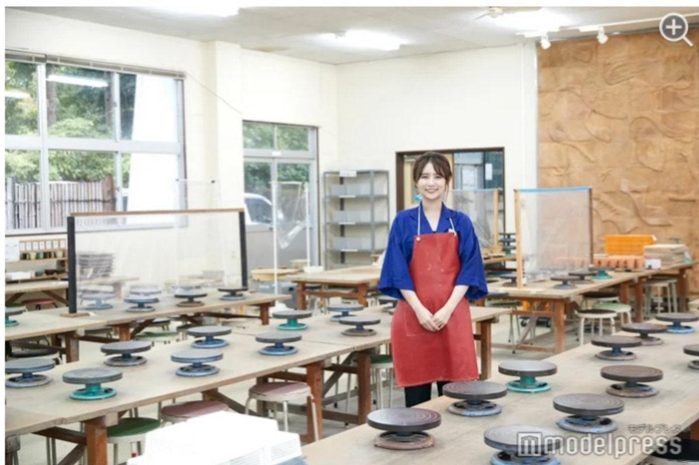
体験ルーム