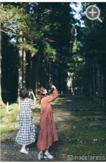
差し込む木漏れ日がとても美しいので、スマホ片手にシャッターが止まらない。