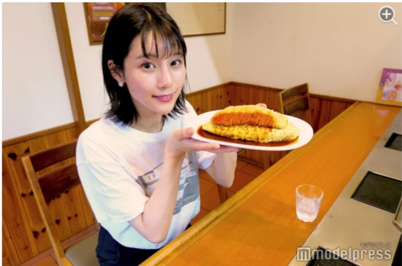
ボリュームたっぷりのように見えて…意外とペロリといけちゃう！

ボルガライスとは、鶏肉と玉ねぎの入ったオムライスに、サクッと揚がった柔らかいとんかつが乗った、ボリューム満点な一皿。かかっている洋食ソースは特に美味しく、お店秘伝のものでレシピは企業秘密だそう。濃厚なデミグラスソースよりはあっさりしていて、ケチャップよりもコクがある、その絶妙な味は絶品！