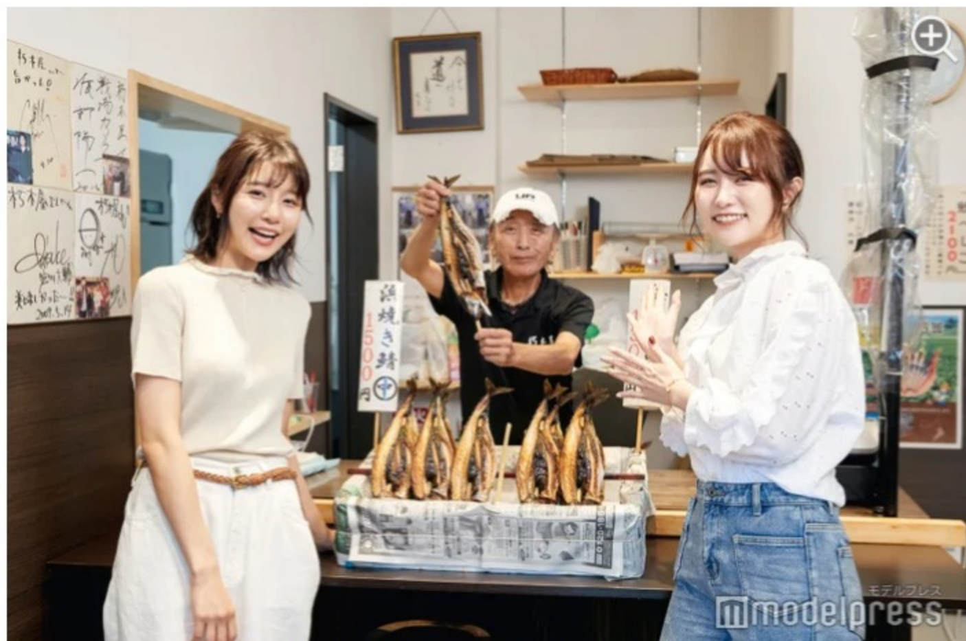
元気良く鯖が売られている雰囲気もまた楽しい。

創業260年余にもなる元祖・鯖の専門店として有名な「朽木屋」は、京へ鯖を運んだ「鯖街道」に位置するお店です。「朽木屋」がある若狭小浜は、かつて飛鳥・奈良時代から朝廷へ海産物を提供する御食国（みけつくに）として栄えた場所。