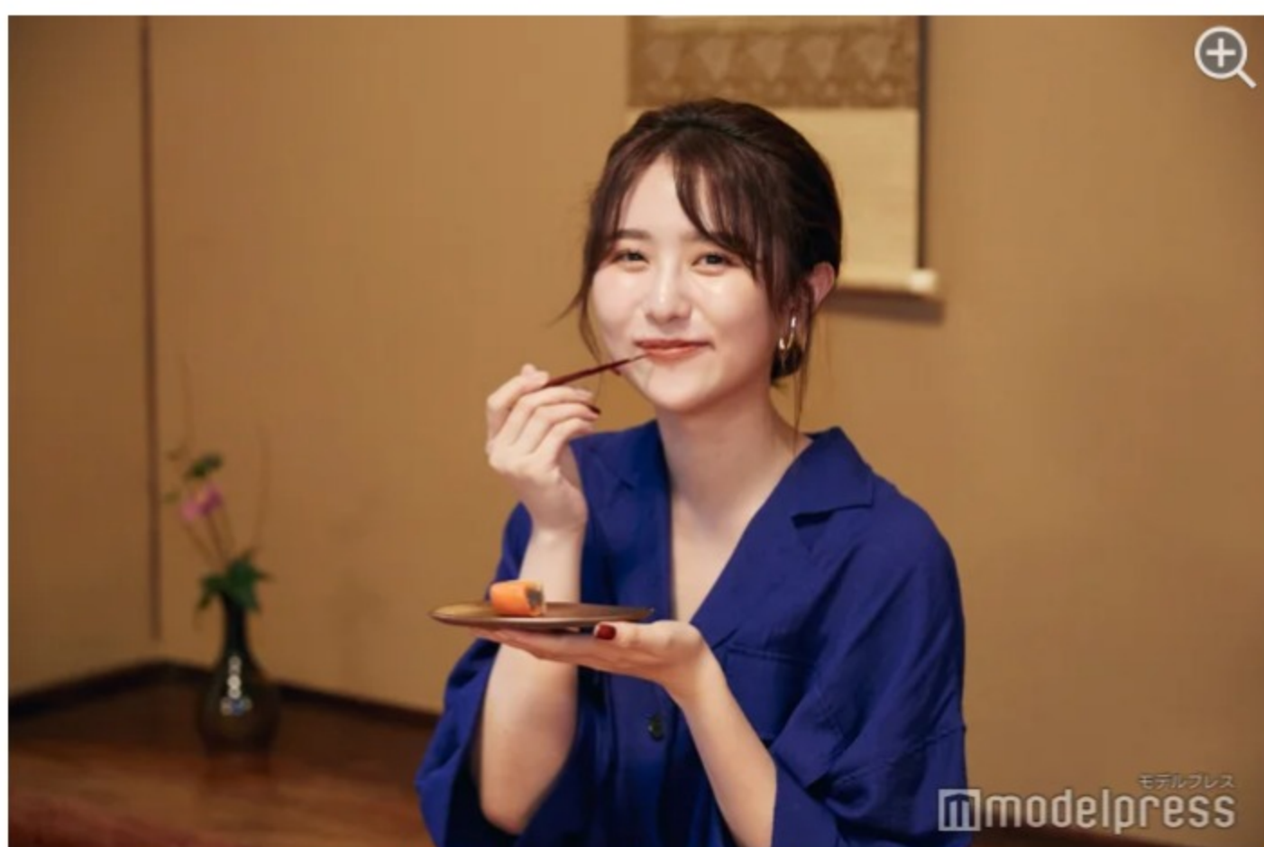
お茶菓子も美味しくて、ホッと一息。

「越前古窯博物館」の旧水野家住宅は越前焼研究の第一人者である水野氏の旧宅を移築・復元した国登録有形文化財の古民家。時代を感じる空間では、実際に越前焼の茶碗で美味しいお抹茶と和菓子を頂くことができます(生菓子600円・干菓子400円)。贅沢なひと時を体感してみてください。