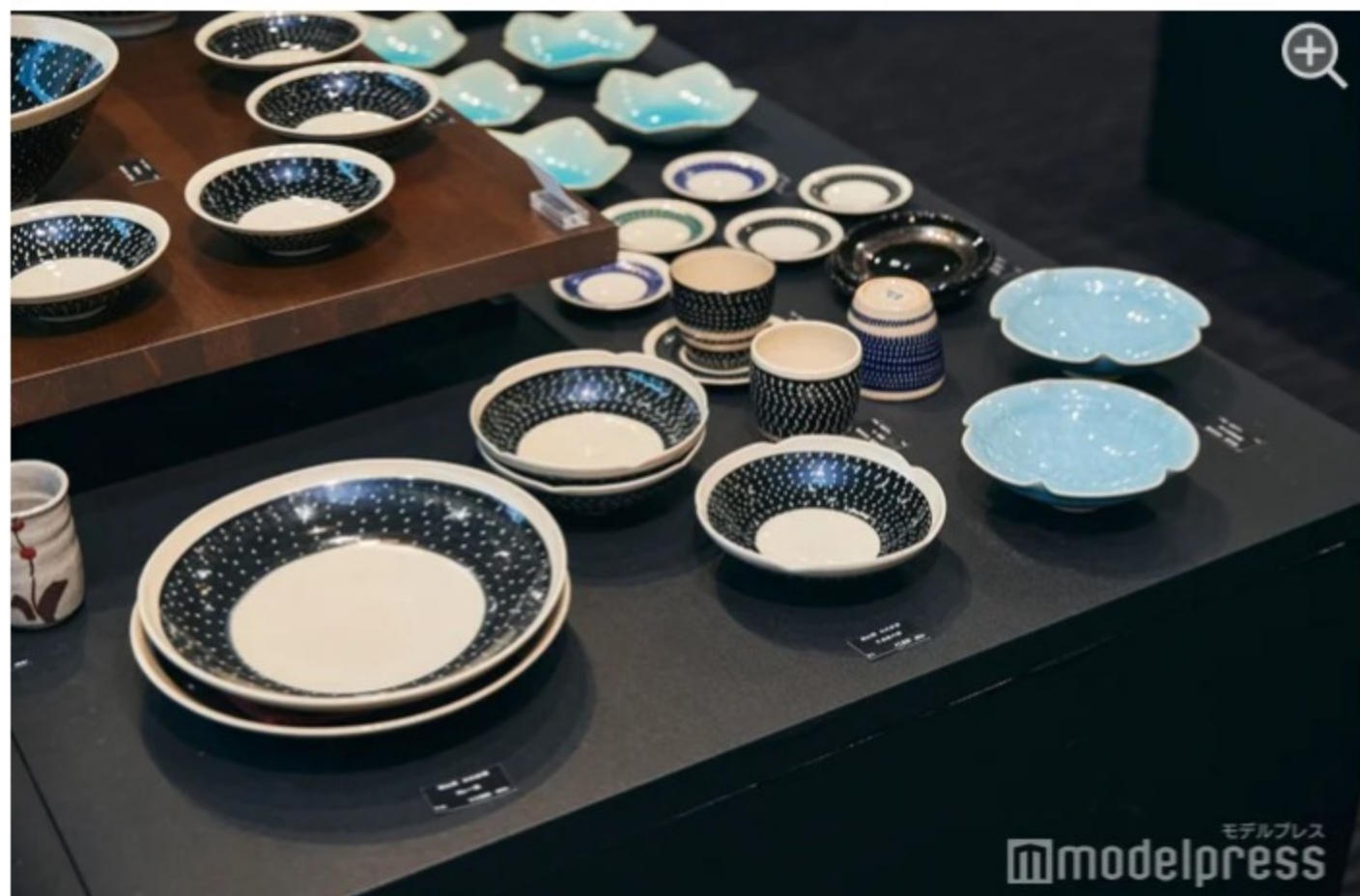
お気に入りの作品を買って帰って、旅の思い出に浸るのも楽しい。

スーベニアショップでは、福井県内の約40人の作品を販売しており、様々な越前焼が揃っています。ここでしか買えない1点ものもあるので、見だすとついつい欲しくなって止まらないほど。越前焼にハマったら、最後にこのスーベニアショップに立ち寄るのも忘れずにどうぞ。