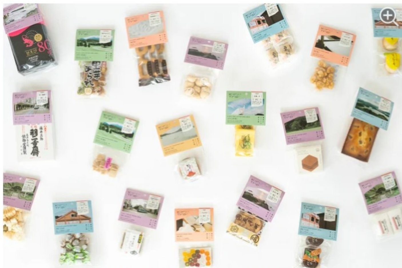
これからも商品ラインナップが増えていく予定。乞うご期待！／提供画像

「キリトリップ」のお土産は、数ある福井県のお土産の中でも、おすすめしたい商品をたくさんピックアップ。5つのエリア毎にそれぞれおすすめの商品をセレクトしています。2020年12月15日～約1ヶ月ほどは「菓子類」20種類のトライアル販売を実施。その後、2021年度には加工品も加わり本格販売予定となっています。