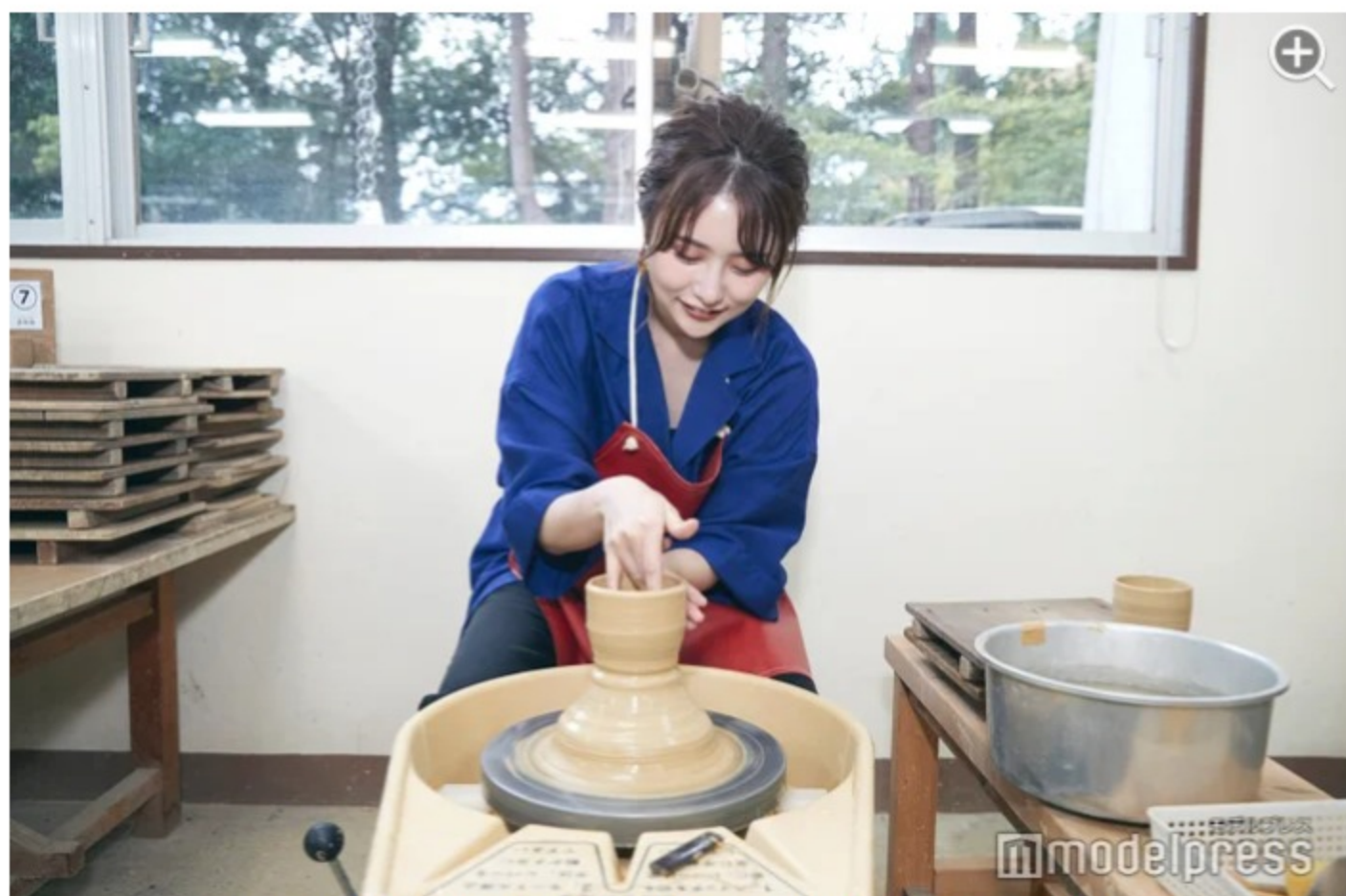
越前焼を自分で作成！初心者でも丁寧に教えて貰えるので安心です。

福井を代表する越前焼の伝統と魅力を発信する「越前陶芸村」の中心施設である「福井県陶芸館」で陶芸教室を体験してみたいかたがでしょうか？スタッフの方が丁寧にサポートしてくれるので、手ひねり・絵付けなど初めての陶芸体験でも、子どもから大人まで楽しく体験することができます。電動ろくろ体験は3,000円、手ひねり体験は1,500円で体験が可能。