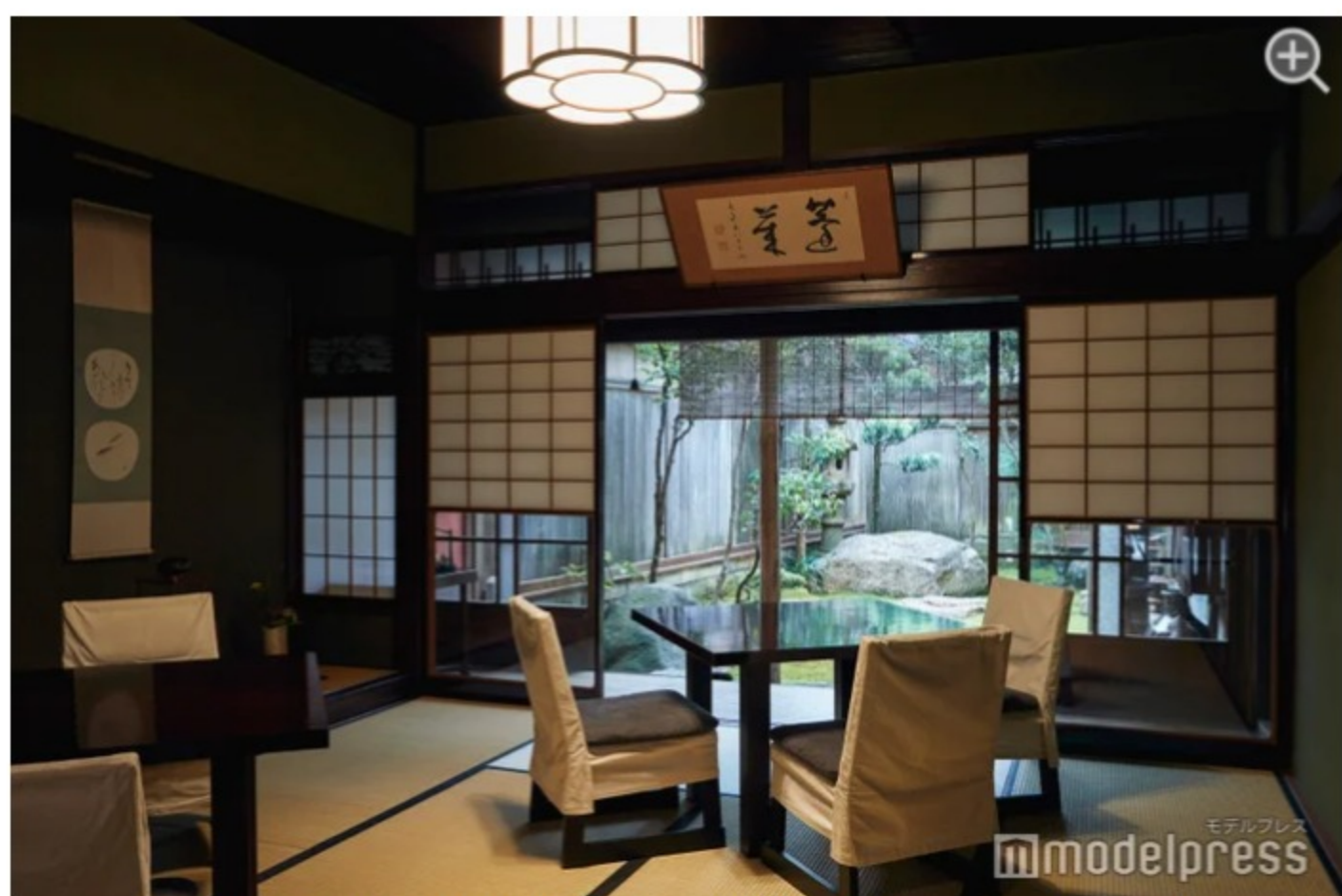
客室から見える中庭。静かな空間で頂くとよりお蕎麦が美味しく感じられます。

美味しい元祖越前そばを食べるならここ。約160年続く歴史ある老舗蕎麦屋の「うるしや」です。お店は築100年以上にもなる建物を利用した、風情ある佇まい。中庭を眺めながら、静かな空間でゆっくりとお蕎麦を味わうことができます。