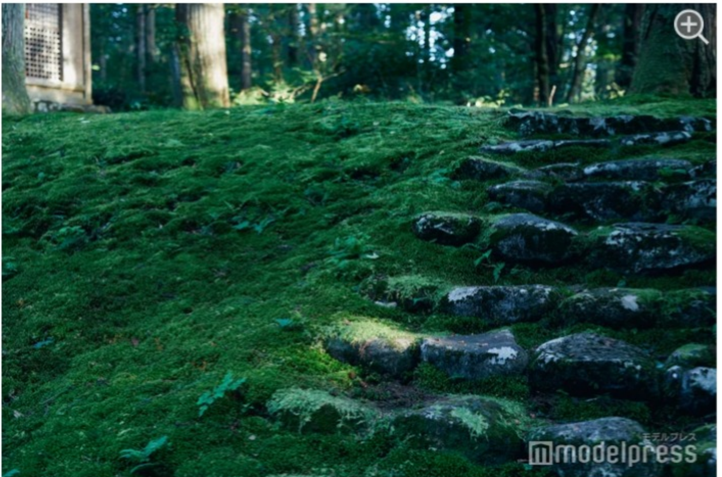
どこを見渡してもびっしりと苔むしている風景は圧巻です。

歴史を知るほど、当時の栄華がひっそりと佇んでいるようで、さらに神秘的な場所に感じられるでしょう。平泉寺の参道は、コースによっては40分～80分とあり、梅雨の時期や雨が降った後は足元が非常に滑りやすいため、歩きやすい恰好と靴で拝観をどうぞ。夏でもひんやり涼しい場所なので、一枚羽織ものがあると便利です。美しい緑の世界に包まれながら、非日常的な空間を楽しんで。