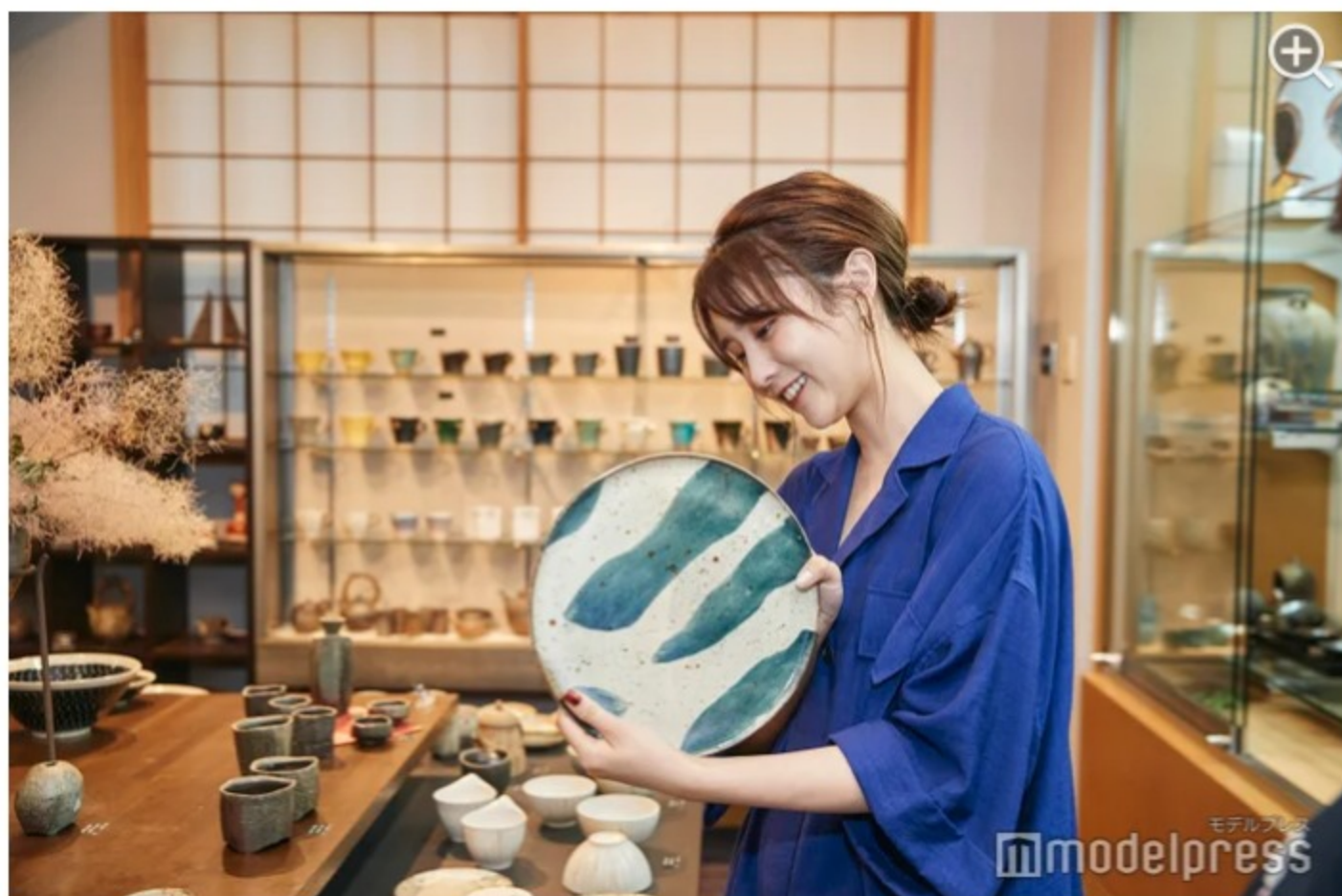
1点ものの素晴らしい作品が多く、買い物欲がピークに！

お抹茶についてくる生菓子は季節によって変わるので、シーズン毎の味を楽しめます。期間限定の和スイーツもあるので、陶芸教室や資料館を見てちょっと疲れたら、一息しに立ち寄るのもおすすめ。