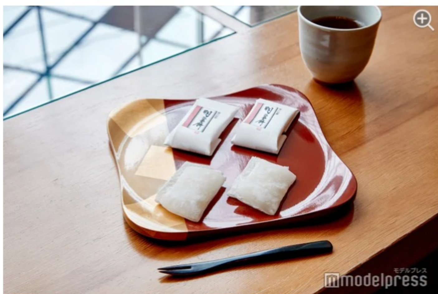
上品で繊細な甘さの羽二重餅は、一度食べたら病みつきに！

他にも、羽二重餅入りのどら焼きや、新作のカカオ羊羹、注文してから焼き上げる出来立てのみたらし団子など、和菓子の種類も豊富にあります。生菓子なので日持ちは1週間くらいとのこと。お土産に持ち帰る時は、20日ほど持つ真空パックタイプのものでおすすめです。喜ばれること間違い無しの美味しい福井銘菓で、ほっと一息安らぐ午後を過ごしてみてください。