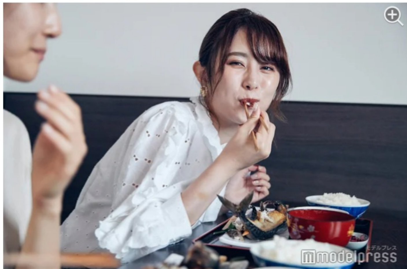
脂ののった焼きたての鯖は、ここでしか味わえない美味しさ！

焼き魚と言えば大根おろしと一緒に食べるのが定番ですが、こちらではおろし生姜といただくのがツウな食べ方。そのまま味わうもよし、生姜でピリッと味を変えるのもよし、鯖の美味しさを堪能してみてください。大きな1枚でボリュームがあるように見えるけど、意外と丸ごとペロっと食べられちゃいます。