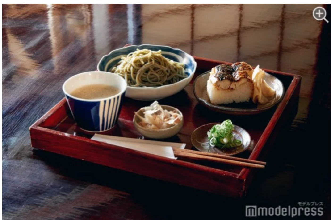
鯖の押し寿司セットも美味しいので、こちらもおすすめ。

蕎麦つゆには辛味大根のおろし汁がたっぷり入っているのが越前そばの特徴。ツンとした辛さが癖になり、口に運ぶお箸の手が止まりません。