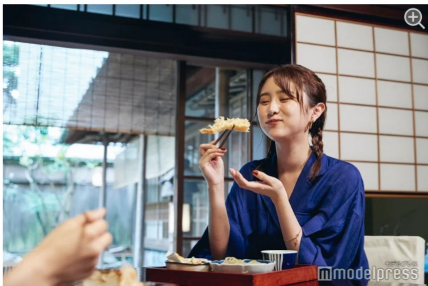
美味しいお蕎麦とサクサクの天ぷらに笑みがこぼれます。

ランチで人気のメニューNo.1は、天ぷら盛りのセット。揚げたての天ぷらと辛みのある蕎麦つゆのマリアージュが絶品。単品で注文できる福井名産の鯖の押し寿司セットも美味しいので、友達とシェアしながら食べても良いかも。