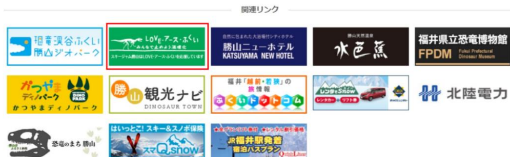
ホームページへのロゴ・リンク掲載