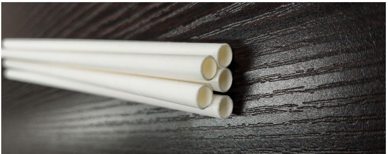
プラスチック製ストローから紙製ストローへ切替