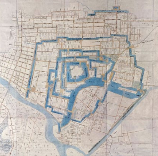
福井御城下之絵図(複製、部分、当館蔵) 原資料:御城下之絵図(松平文庫蔵、福井県文書館保管)