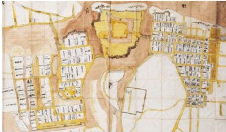
若洲小浜細見之図(部分、当館蔵)