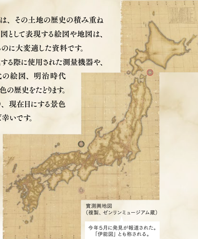
實測輿地図 (複製、ゼンリンミュージアム蔵)