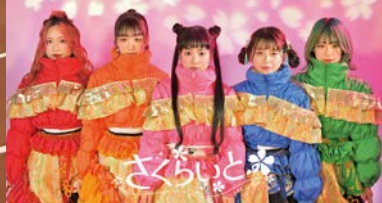
ふくい桜マラソン2025 大会公式サポーター 福井伝統工芸アイドルグループ さくらいと