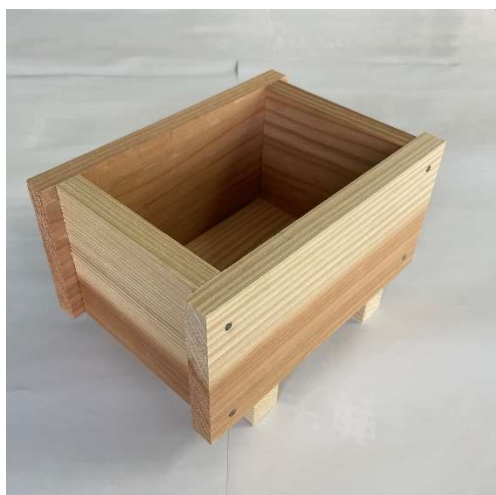
県産スギを使ったミニプランター (両日20セット)

② 木工体験会 ミニプランターづくり(500円/セット)、木製小物づくり(無料)