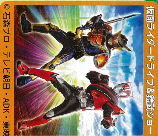
仮面ライダーダイナ&超武ショー

パレードのため、午前9時30分～10時まで千住間道から南千住野球場までの周辺道路が交通規制されます。