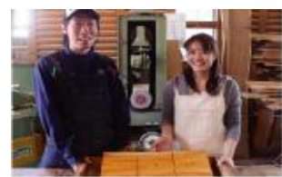
ブライダル手作りサービス

(有)木工房蔵は、木目を生かした三連時計を開発し、結婚式・披露宴での両親へのプレゼントとして人気商品になっている。この商品を販売する中で、結婚式・披露宴にかかわる商品を手作りしたいという要望が多く寄せられたため、木製の新たなブライダルギフトの開発・提供と多店舗展開を検討していた。一方、武生森林組合は、越前スギをはじめとする良質な木材を有しているものの、木材需要や森林整備をとりまく環境が変化する中で、間伐材の販路開拓が急務であった。(有)木工房蔵が必要とする木材は間伐材で対応できることから、両者の思いが一致し、連携して本事業に取り組むこととなった。