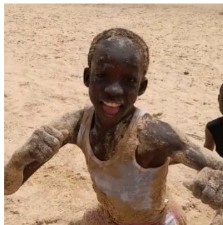
ごうかいに砂遊び