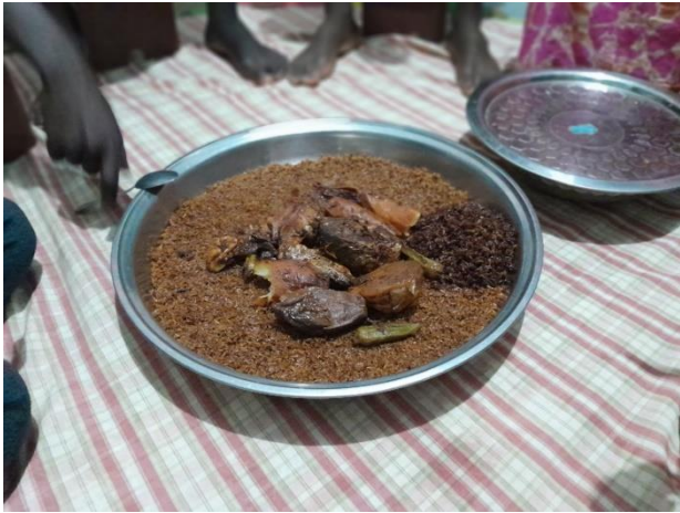
大皿をみんなでかこんで食べます